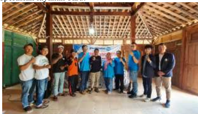
Gambar 13. Monitoring dan Evaluasi Kegiatan Pengabdian

Setelah implementasi, dilakukan monitoring dan evaluasi terhadap dampak dan efektivitas kegiatan, yang dilaksanakan dalam kurun waktu satu hingga dua bulan pasca kegiatan utama. Tujuan dari tahap ini adalah menilai keberhasilan penggunaan denah dan sistem digital, serta mengidentifikasi kendala yang dihadapi mitra dalam pengoperasian layanan baru.