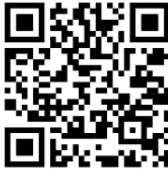
Gambar 8. QR Code Pemesanan Digital

Gambar 8 memperlihatkan QR Code yang terhubung ke sistem pemesanan digital melalui Google Form. Dengan sistem ini, wisatawan dapat melakukan pemesanan secara mandiri, efisien, dan cepat, termasuk pengisian data dan pembayaran DP melalui metode digital (QRIS). Langkah ini merupakan wujud digitalisasi layanan yang bertujuan untuk mempermudah proses booking spot camping ground .