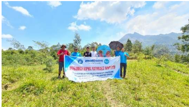
Gambar 4. Pemetaan Tata Letak Camping Ground di Ekowisata Kalitalang bersama Mitra

Gambar 4 menunjukkan proses pemetaan bersama mitra di lapangan, yang mencerminkan keterlibatan aktif dari komunitas lokal dalam merancang kawasan wisata mereka sendiri.