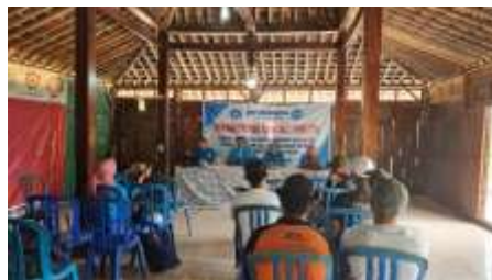
Gambar 9. Pendampingan Pemesanan Digital oleh Tim Pengabdian Kepada Masyarakat

Agar sistem digital dapat digunakan secara optimal, tim pengabdian menyelenggarakan pendampingan teknis kepada anggota Pokdarwis mengenai cara penggunaan sistem pemesanan tersebut. Pendampingan mencakup pengenalan sistem, alur pemesanan, pengecekan data pemesan, hingga proses konfirmasi pembayaran.