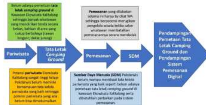
Gambar 2. Fishbone Diagram Permasalahan Mitra

Berikut analisis situasi yang disajikan dalam bentuk fishbone diagram pada gambar 2 berikut.