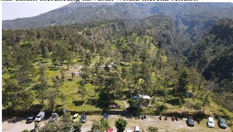
Gambar 5. Foto Area Ekowisata Kalitalang Menggunakan Drone

Gambar 4 menunjukkan proses pemetaan bersama mitra di lapangan, yang mencerminkan keterlibatan aktif dari komunitas lokal dalam merancang kawasan wisata mereka sendiri.