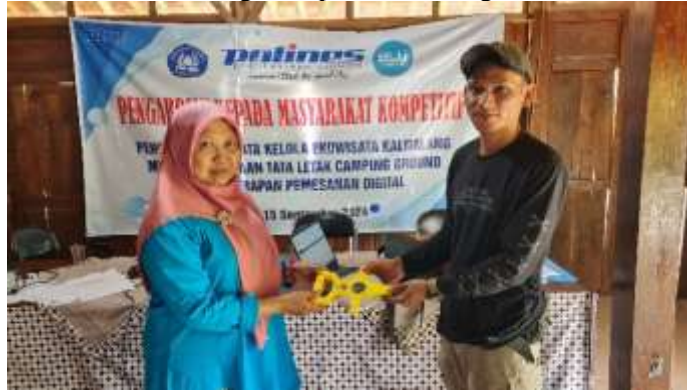
Gambar 12. Serah Terima Barang

Gambar 9 hingga Gambar 11 menunjukkan proses pelatihan yang dilakukan secara langsung oleh tim pengabdian, termasuk oleh ketua tim. Pendekatan ini menjamin bahwa setiap anggota Pokdarwis memiliki pemahaman teknis yang memadai untuk mengelola pemesanan digital secara mandiri.