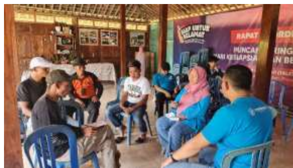
Gambar 10. Pendampingan Pemesanan Digital oleh Ketua Tim Pengabdian Kepada Masyarakat