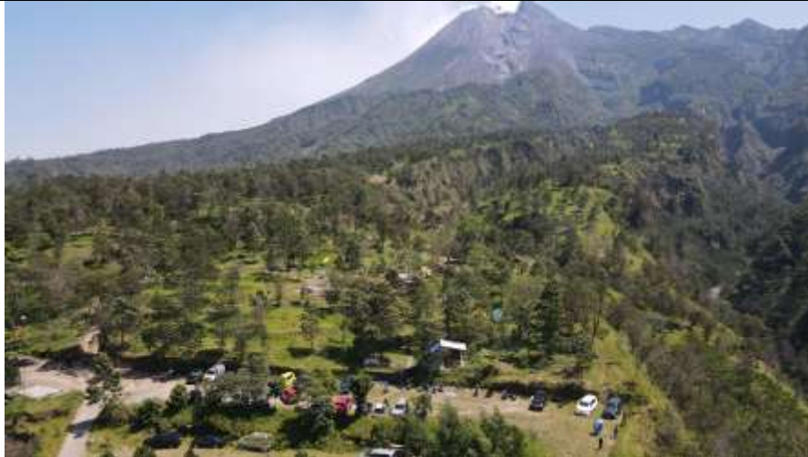
Gambar 3. Lokasi Pengabdian kepada Masyarakat