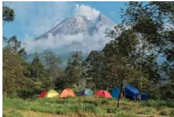
Gambar 1. Ekowisata Kalitalang

Desa Balerante terletak di Kecamatan Kemalang, Kabupaten Klaten. Secara geografis, Desa Balerante terletak di lereng Gunung Merapi yang langsung berbatasan dengan taman nasional Gunung Merapi (Wijayanti, dkk., 2020). Letak geografis tersebut merupakan potensi bagi Desa Balerante untuk mengembangkan pariwisata alam. Salah satu potensi pariwisata di Desa Balerante adalah kawasan Ekowisata Kalitalang (Putra, 2024). Kondisi alamnya yang indah dan lestari menjadi daya tarik yang kuat bagi wisatawan untuk berkunjung. Berikut adalah pemandangan alam di kawasan Ekowisata Kalitalang yang disajikan dalam gambar 1 berikut.