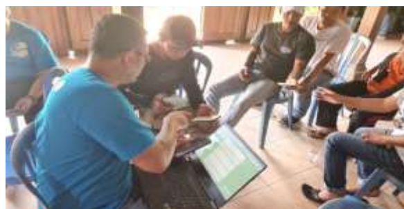
Gambar 11. Pendampingan Pemesanan Digital oleh Anggota Tim Pengabdian