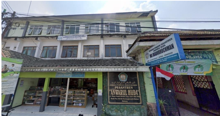
Gambar 1. Lokasi Kegiatan

Dalam mengatasi permasalahan yang dihadapi pelaku usaha dilingkungan pondok pesantren tersebut, tim Pengabdian akan memberikan pengetahuan tambahan yang dilaksanakan dalam bentuk sosialisasi/ penyuluhan tentang tantangan global yang akan dihadapi dunia usaha di masa yang akan datang, sosialisasi tentang pentingnya Usaha bersama yang saling menguatkan antar wirausaha, perkembangan teknologi untuk menghadapi permasalahan tersebut dan mengajak para santri untuk mulai menyadari dan membuat perencanaan bisnis, memutuskan permasalahan bisnis dengan estimasi dan pembukuan yang tepat (Suhermi & Safitri, 2010).