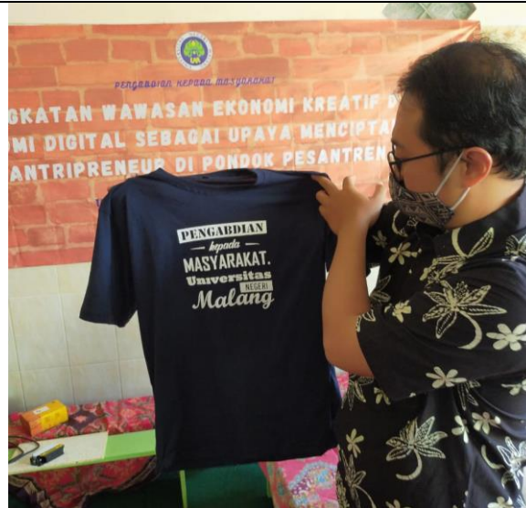
Gambar 5. Contoh Hasil Pelatihan

Sesi ini para santri dibagi menjadi 3 kelompok, 1) kelompok Desain, 2) Kelompok Produksi, 3) kelompok pengemasan, dengan harapan nantinya ada spesialisasi kerja pada proses produksi mandiri kedepannya. Sesi ini juga memberikan kesempatan secara bergantian kepada para santri untuk mencoba mengaplikasikan alat yang telah disediakan dengan harapan Ketika keluar dari pondok para santri minimal memiliki skill dasar dalam sablon digital.