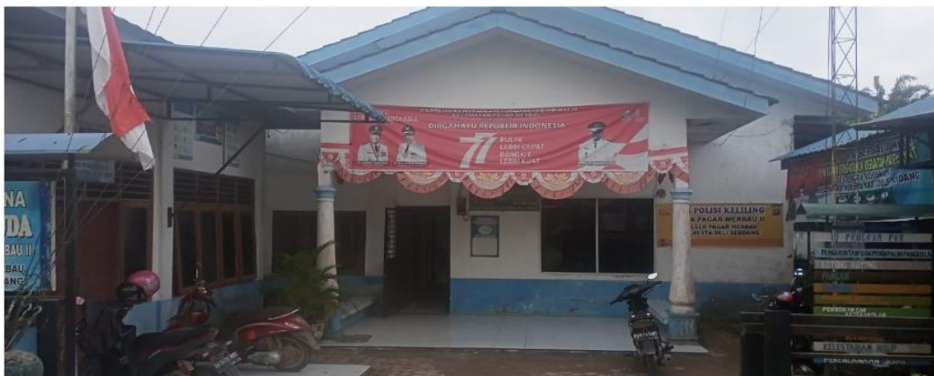
Gambar 3. Kantor Desa Pagar Merbau II Deli Serdang

Berikut adalah tampilan kantor desa Pagar Merbau II: