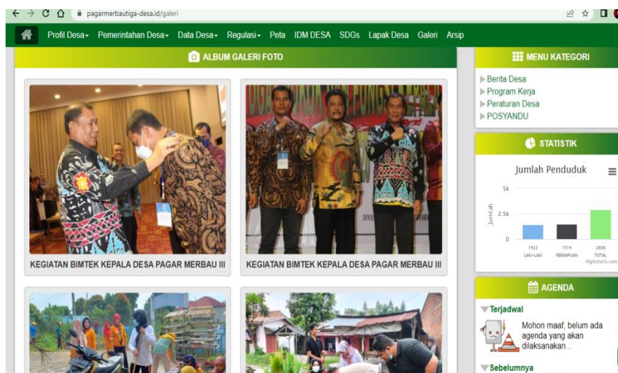
Gambar 5. Contoh tampilan Galeri Desa

Tampilan diatas adalah tampilan utama untuk media informasi yang akan memuat berita utama dan perkembangan terkini mengenai kinerja aparatur desa. Setiap warga dapat mengirim pesan untuk operator desa dalam bentuk kritikan dan saran, serta pertanyaan yang ingin dituju kepada aparatur desa