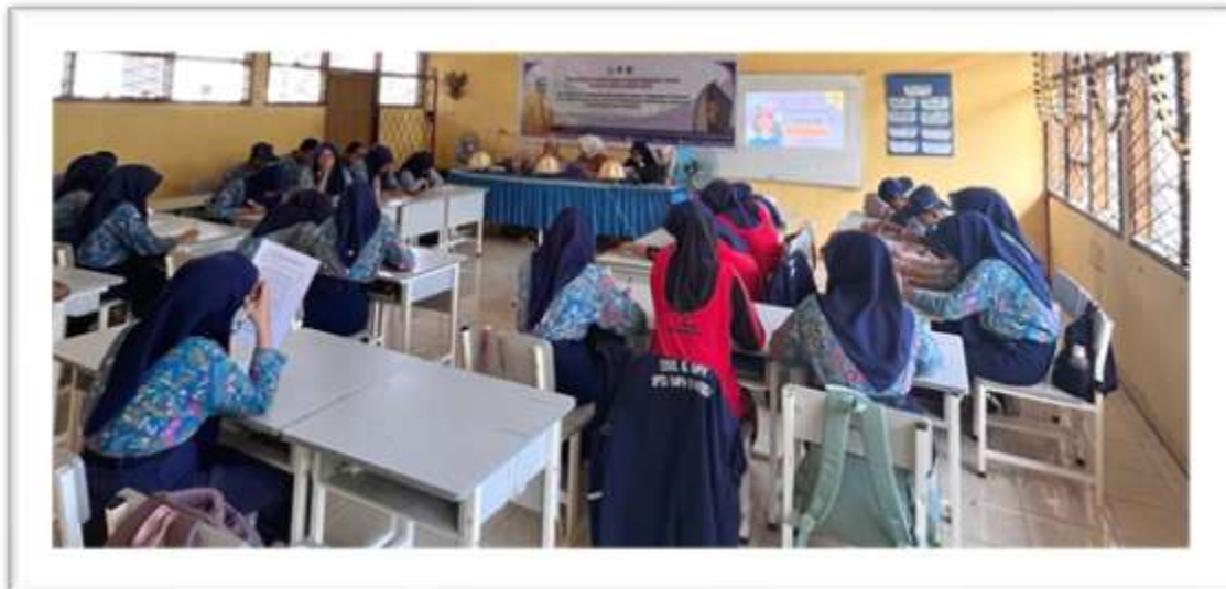
Gambar 1. Kegiatan Pemateri di Kelas

Berdasarkan data yang dikumpulkan di SMP 9 Maros menunjukkan adanya peningkatan pengetahuan serta kesadaran untuk melindungi diri terhadap pelecehan maupun kekerasan seksual setelah diberikan sosialisasi pencegahan kekerasan seksual.