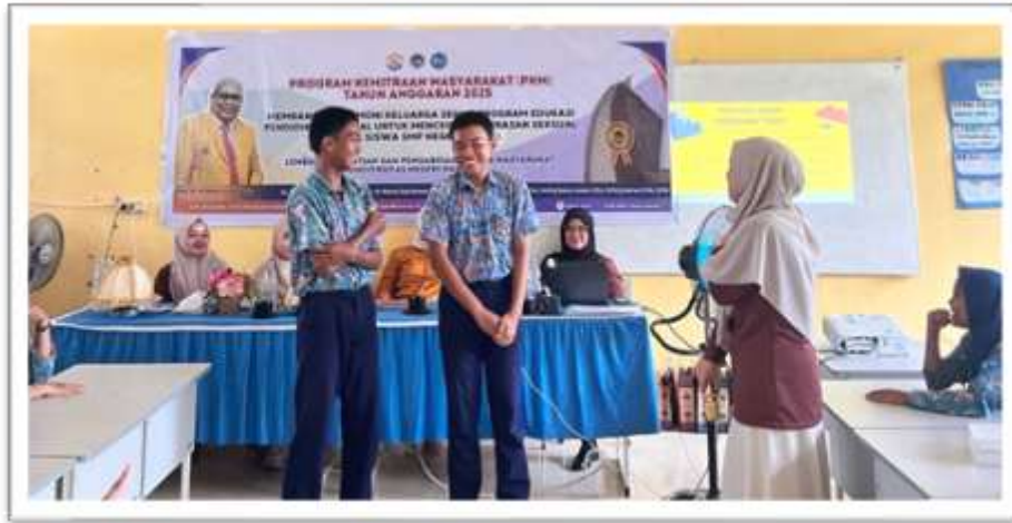
Gambar 3. Pelaksanaan Role Playing terkait kekerasan seksual di sekolah

Pada saat dilakukan role-play dua orang siswa sedang mempraktekan seolah seorang siswa mencolek temannya, kemudian temannya menangkis tindakan tersebut dan memberi jarak atas tindakannya. Selain peningkatan pengetahuan, kegiatan juga memberikan dampak pada aspek keterampilan dan kesadaran diri siswa. Dalam simulasi dan role play, siswa menunjukkan keberanian untuk menolak tindakan yang tidak pantas, menjaga batasan pribadi (personal boundaries), serta mencari bantuan kepada pihak yang dipercaya seperti guru dan orang tua. Beberapa siswa bahkan mampu mempraktikkan teknik komunikasi asertif secara jelas dan tegas, meskipun sebelumnya masih merasa canggung.