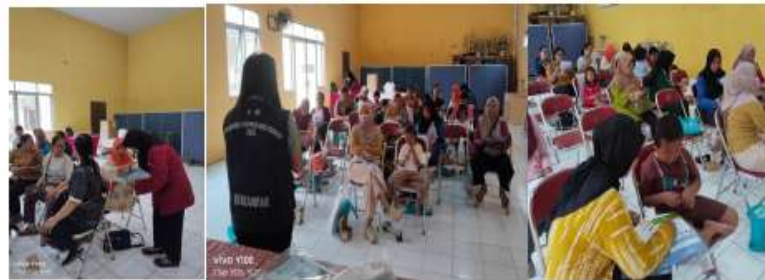
Gambar 3. Kegiatan Implementasi Program