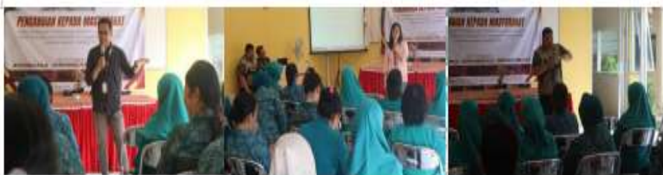
Gambar 2. Kegiatan Sosialisasi Ibu-ibu Kader PKK

Tahap awal berupa sosialisasi kepada kader PKK Kelurahan Bugangan mengenai urgensi literasi keuangan berbasis multimodalitas bagi anak-anak. Kegiatan sosialisasi dilakukan dalam bentuk seminar interaktif. Materi sosialisasi mencakup konsep dasar literasi keuangan, pentingnya peran keluarga dan masyarakat, serta strategi pembelajaran yang sesuai dengan karakteristik anak usia sekolah dasar. Untuk mendukung tahapan ini digunakan modul sosialisasi cetak, slide presentasi, video pengantar, dan kuesioner pra-sosialisasi untuk memetakan pengetahuan awal peserta.