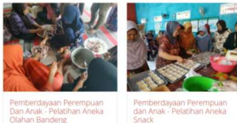
Gambar1. Kegiatan Pemberdayaan Perempuan di Kelurahan Bugangan

mendidik anak dalam pengelolaan keuangan sejak dini sangat penting untuk membentuk kebiasaan finansial yang sehat di masa depan. Oleh karena itu, diperlukan inisiatif yang lebih komprehensif dalam program pemberdayaan masyarakat, yang tidak hanya meningkatkan keterampilan ekonomi orang tua, tetapi juga membekali mereka dengan pemahaman tentang literasi keuangan untuk diterapkan dalam keluarga, terutama dalam mendidik anak-anak agar lebih cerdas dalam mengelola uang. Selain itu, Kelurahan Bugangan ternyata masih menghadapi tantangan utama, yaitu rendahnya tingkat literasi keuangan di kalanganarganya. Banyak penduduk belum memahami pentingnya pengelolaan keuangan pribadi yang baik (Santoso, Estrini, and Anggraini 2024) meskipun mereka sudah terbiasa menggunakan produk dan layanan keuangan yang tersedia. Hal ini tidak hanya memengaruhi kemampuan mereka dalam mengambil keputusan keuangan yang bijak, tetapi juga berdampak pada kesejahteraan ekonomi keluarga secara keseluruhan. Berikut Gambar dibawah ini menunjukkan kegiatan pemberdayaan perempuan yang masih berfokus pada pelatihan memasak untuk menciptakan peluang usaha.