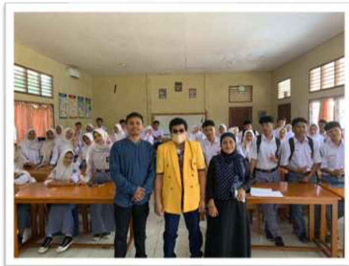
Gambar 1. Foto Bersama Peserta PKM Siswa SMA Negeri 2 Kota Ternate

Permasalahan ini menunjukkan perlunya intervensi dalam bentuk edukasi dan pelatihan melalui kegiatan Pengabdian kepada Masyarakat (PKM) untuk membekali siswa dengan pengetahuan dan keterampilan digital.