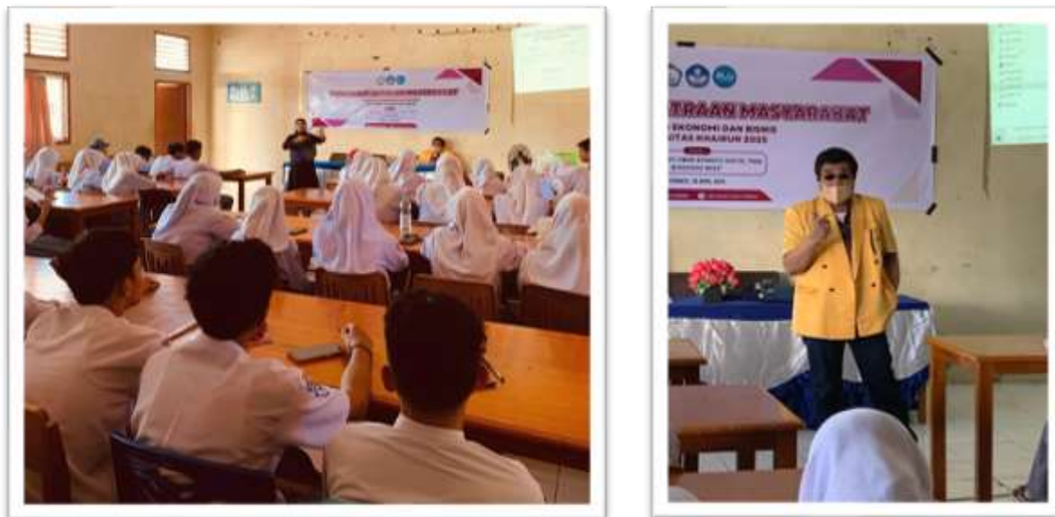
Gambar 2. Suasana Kegiatan ketika penyampaian materi dari narasumber

Tingkat kesulitan kegiatan relatif sedang, karena materi dapat diterima siswa dengan baik berkat penggunaan bahasa sederhana dan pendekatan studi kasus lokal. Peluang pengembangan kegiatan ke depan sangat terbuka, baik dalam bentuk program lanjutan berupa workshop intensif maupun pendampingan berkelanjutan dalam pengembangan UMKM siswa berbasis digital. Dengan demikian, PKM ini bukan hanya memberikan dampak jangka pendek berupa peningkatan pengetahuan, tetapi juga mendorong semangat wirausaha muda untuk berdaya saing di era digital.