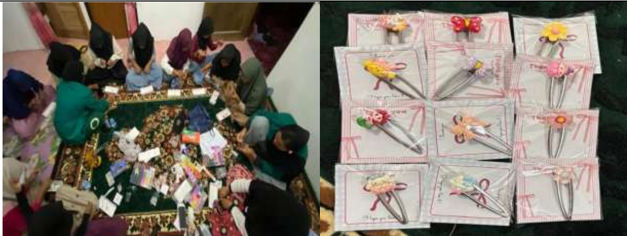
Gambar 3. PKM di Pulau Breueh

Transformasi sosial juga tampak melalui peningkatan kepercayaan diri, partisipasi aktif dalam kegiatan komunitas, dan penguatan solidaritas antarpeserta. Jika sebelum program perempuan nelayan relatif kurang terlibat dalam kegiatan sosial ekonomi, pasca intervensi terlihat peningkatan peran perempuan dalam pengambilan keputusan di rumah tangga dan komunitas. Perubahan ini bukan sekadar efek samping kegiatan ekonomi, melainkan outcome sosial yang memperkuat ekosistem dukungan bagi keberlanjutan usaha. Kekuatan jejaring sosial internal berfungsi sebagai modal sosial—memfasilitasi pertukaran informasi, berbagi praktik baik, dan mitigasi risiko usaha melalui dukungan kolektif.