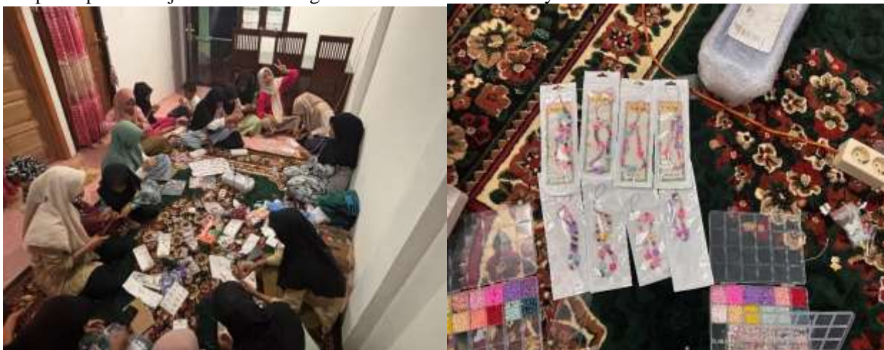
Gambar 2. Hasil kreatifitas dari pelatihan kerajinan tangan pada remaja

Kegiatan di aspek pemasaran bertujuan untuk menghubungkan produk manik-manik dengan pasar yang lebih luas. Pelatihan mencakup strategi branding , penentuan harga, dan pemasaran digital. Remaja diajarkan cara memberi nama produk mereka (misalnya "Mutiara Pulo Aceh"), membuat logo sederhana, dan mengemas produk dengan menarik. Mereka juga dibimbing dalam membuat akun media sosial khusus untuk menjual produk, serta strategi untuk menjangkau audiens secara online . Produk kerajinan manik-manik dari Pulo Aceh kini memiliki identitas visual yang lebih profesional dan siap dipasarkan secara online . Melalui platform digital, produk-produk ini mulai dikenal oleh masyarakat di luar Pulo Aceh. Hal ini membuka peluang bagi jangkauan pasar yang lebih luas dan potensi peningkatan penjualan, yang pada akhirnya akan meningkatkan pendapatan para remaja dan mendorong mereka untuk terus berkarya.