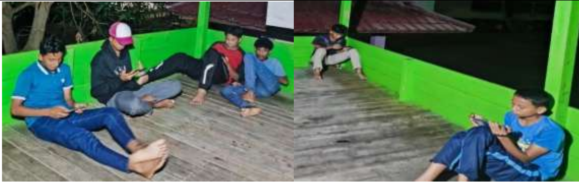
Gambar 1. Kondisi Mitra atau Remaja sedang bermain Gadget

Gambar diatas menunjukkan bahwa remaja saat ini terlalu sibuk dengan media sosial yang dapat diakses dimanapun mereka berada, hal inilah membuat remaja saat ini cenderung malas dalam mengembangkan potensi dan mencari aktifitas lain yang bermamfaat. Karakter seorang anak dibangun melalui apa yang didengarkan, apa yang dilihat dan juga dirasakan. Melalui seluruh indera yang manusia miliki inilah, akan muncul pembelajaran yang kuat terkait dengan apa yang diterima oleh indera. Bila anak terbiasa dengan dunia media sosial sejak kecil maka akan berdampak buruk saat desawa nanti, dan sebaliknya bila anak terbiasa dengan dunia wirausaha sejak kecil, maka karakter inilah yang akan muncul nanti ketika anak dewasa.