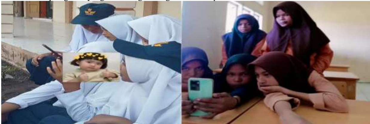
Gambar 2. Remaja dengan kesibukannya saat di Sekolah

Berdasarkan bidang permasalahan yang diangkat, yaitu pemberdayaan remaja pesisir pantai Pulo Aceh melalui kerajinan tangan, berikut adalah analisis kondisi eksisting mitra. Kurangnya Pemanfaatan Waktu Luang dan Potensi Diri, kondisi eksisting ini banyak remaja di Pesisir Pantai Pulo Aceh memiliki waktu luang yang cukup banyak, terutama setelah jam sekolah atau kegiatan melaut. Waktu luang ini sering kali tidak dimanfaatkan secara produktif, dan potensi kreatif yang mereka miliki tidak terasah. Mereka memiliki akses terbatas terhadap kegiatan yang bisa mengembangkan keterampilan non-akademik.