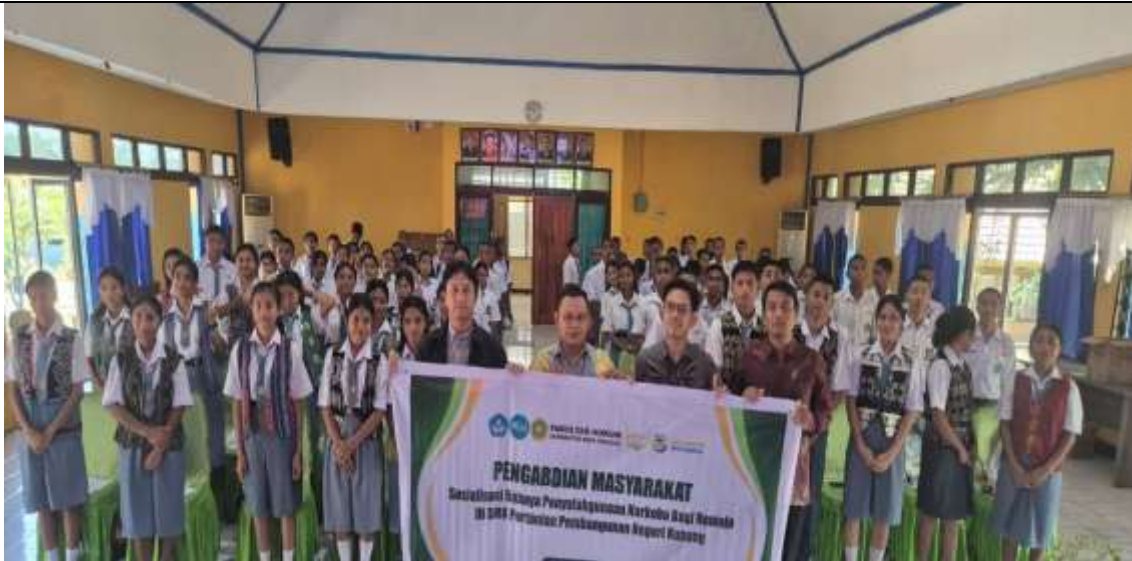
Gambar 1. Foto Tim Pengabdian dan siswa/i SMK PP Negeri Kupang