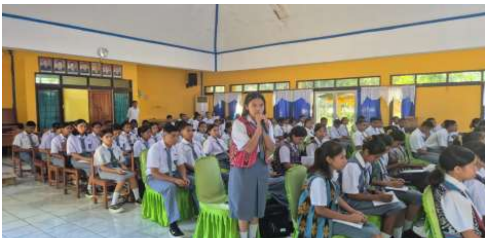
Gambar 3. Diskuis dan Tanya Jawab