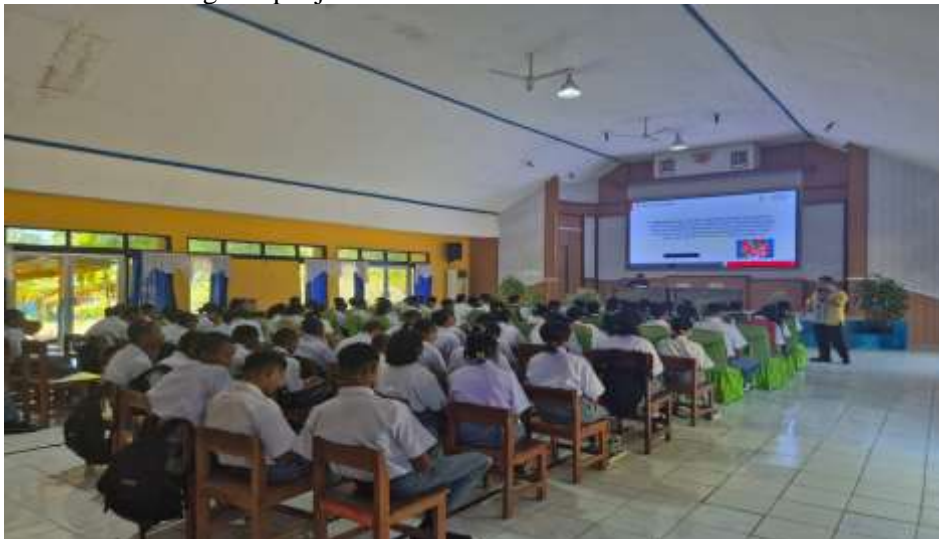
Gambar 2. Foto saat kegiatan berlangsung