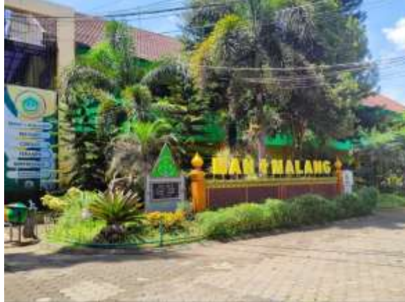
Gambar 1. Lokasi pengabdian di MAN 1 Malang

Berangkat dari kebutuhan mendesak untuk menanamkan Global Citizenship Education (GCED) secara lebih sistematis di sekolah menengah, Isu-isu global seperti perubahan iklim, krisis sumber daya, konflik internasional, terorisme, hingga kompetisi ekonomi dunia, menuntut generasi muda untuk memiliki wawasan luas serta kemampuan berpikir kritis agar mampu berperan aktif dalam membangun peradaban yang lebih damai, adil, dan berkelanjutan (Luthfi et al , 2019, Hlm. 1). Meskipun kurikulum Indonesia telah memasukkan nilai-nilai dasar GCED seperti toleransi, penghargaan terhadap keberagaman, dan penghormatan terhadap hak asasi manusia, tetapi pembahasan khusus GCED dan isu global masih sangat terbatas (Mahpudz, Asep, 2023, Hlm. 275-276).