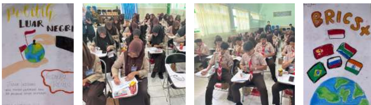
Gambar 4. Refleksi Kreatif Pembuatan Poster

Puncak kegiatan adalah materi utama mengenai BRICS++ yang membahas sejarah, dinamika, serta implikasi keanggotaan Indonesia. Untuk menjaga interaktivitas, digunakan platform Mentimeter agar siswa dapat menyampaikan opini secara real-time. Empat alasan yang ditekankan, berpikir kritis, relevansi karir, kompetensi global, dan kemampuan beradaptasi, selaras dengan tujuan Global Citizenship Education UNESCO (2015). Setelah itu, siswa diarahkan untuk membuat poster sebagai bentuk refleksi kreatif. Metode ini dipilih karena tidak hanya memperkuat daya ingat, tetapi juga mendorong siswa menyusun ide secara visual dan komunikatif (Sari et al., 2023).