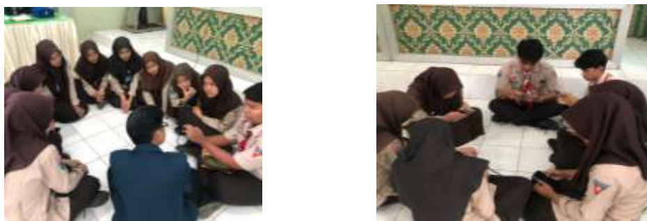
Gambar 3. Focus Group Discussion

Berikutnya, peserta dibagi dalam Focus Group Discussion (FGD) untuk membahas dua pertanyaan kunci: (i) forum multilateral apa saja yang diikuti Indonesia, dan (ii) apa kepentingan Indonesia di dalamnya. FGD ditempatkan sebelum materi lanjutan agar siswa terlebih dahulu membangun perspektif sendiri. Metode ini terbukti mampu melatih keterampilan berpikir kritis dan kolaborasi (Waluyati, 2020). Selanjutnya, materi kedua disampaikan tentang politik luar negeri Indonesia di forum multilateral, dengan penekanan pada sejarah, tujuan, sekaligus tantangan. Pendekatan ini mendorong peserta didik untuk tidak hanya menerima narasi dominan, tetapi juga mengidentifikasi keterbatasan dan kritik.