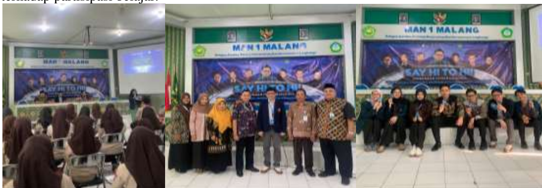
Gambar 2. Pelaksanaan Acara “ Get to Know Indonesia’s Foreign Policy in Multilateral Forum ”

Kegiatan dimulai dengan pre-test berupa pertanyaan tertutup (iya/tidak) yang bertujuan memetakan tingkat pemahaman awal siswa. Hasil pra-uji ini menjadi pijakan untuk menyesuaikan fokus penyampaian materi sehingga relevan dengan kebutuhan peserta (Fadhlya Adri, 2020). Setelah itu, acara dibuka dengan sambutan dari dosen HI Universitas Brawijaya dan pihak sekolah, kemudian dilanjutkan sesi perkenalan oleh mahasiswa HI. Tahap ini berfungsi membangun kedekatan emosional sekaligus meningkatkan keterlibatan siswa, sebagaimana ditunjukkan dalam studi (An et al., 2022) bahwa interaksi fasilitator–peserta berpengaruh positif terhadap partisipasi belajar.