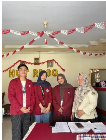
Gambar 1. Diskusi Dan Observasi Kondisi Desa Bersama Perwakilan Pemerintah Desa Dan Masyarakat

Pembaruan berbagai delik hingga model pidana yang terjadi dalam KUHP baru ini menjadi sejalan dengan hasil observasi awal yang telah dilakukan. Sehingga dengan demikian, upaya untuk meningkatkan kesadaran masyarakat dan tokoh di desa adalah hal yang merupakan sebuah upaya yang sejalan dengan pembaruan KUHP yang baru. Bentuk peningkatan kesadaran masyarakat ini kemudian akan diimplementasikan melalui program pengabdian kepada masyarakat dalam kegiatan Kuliah Kerja Nyata Tematik tahap II Tahun 2025.