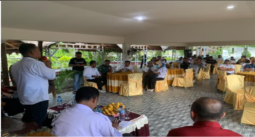
Gambar 2. Penyuluhan Hukum Oleh Akademisi dan Perwakilan Kementerian Hukum Wilayah Gorontalo