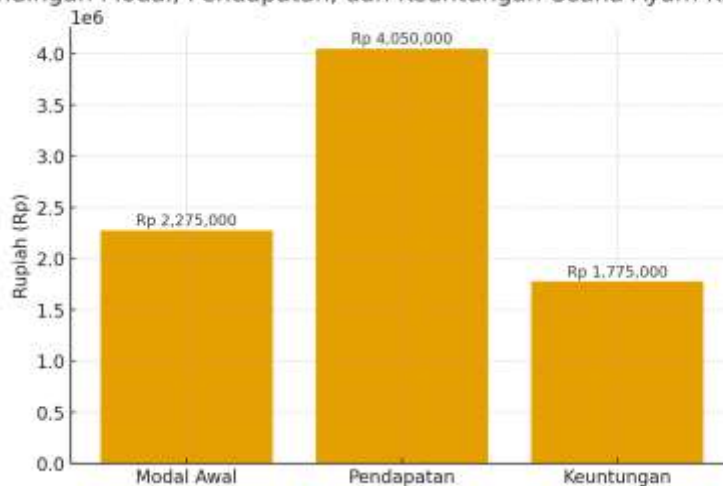
Gambar 2. Perbandingan Modal, Pendapatan, dan Keuntungan