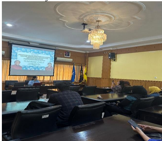
Gambar 1. Suasana pelatihan penganggaran usaha bagi UMKM Kota Malang di Kampus Universitas Brawijaya

mengantisipasi risiko. Kondisi ini menegaskan perlunya pelatihan praktis agar UMKM mampu mengelola keuangan secara lebih sistematis dan berkelanjutan.