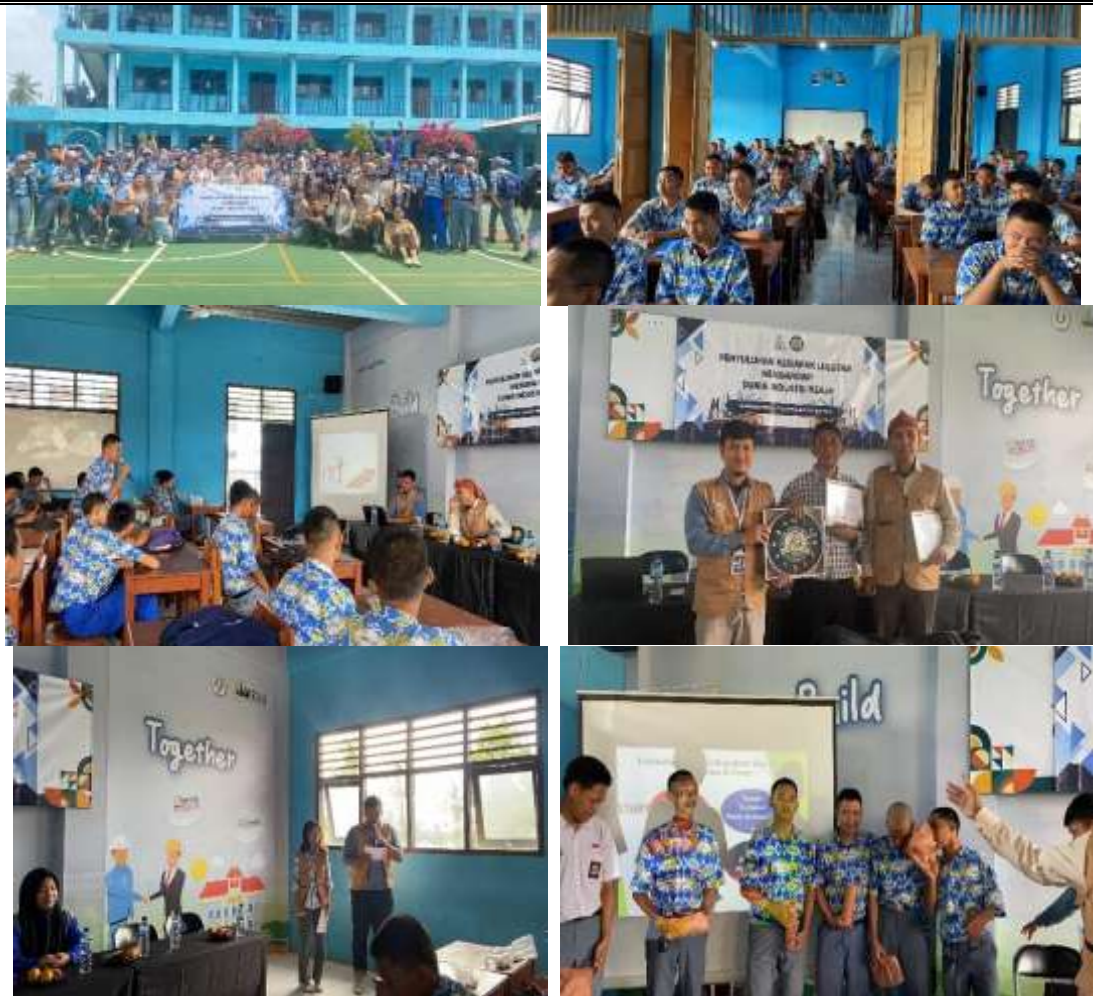
Gambar 1. Proses Kegiatan di SMK Fatahillah 1 Cilegon

Evaluasi dampak kegiatan dilakukan melalui pendekatan kuantitatif-deskriptif menggunakan kuesioner pretest–posttest (skala Likert 1–5) yang mengukur tiga dimensi utama, yaitu mentality readiness, morality, dan work ethos. Selain itu, dilakukan observasi saat simulasi/role play menggunakan rubrik perilaku kerja untuk menilai penerapan sikap dan kebiasaan kerja secara nyata. Hasil kuantitatif berikut disajikan untuk memperkuat kesimpulan program, sehingga pembahasan tidak hanya berbasis uraian naratif, tetapi juga didukung bukti perubahan terukur. Berdasarkan hasil kuesioner, terdapat peningkatan skor rata-rata pada seluruh dimensi setelah kegiatan. Pada dimensi mentality readiness, rata-rata skor meningkat dari 3,12 (pretest) menjadi 4,05 (posttest), dengan selisih 0,93 poin atau peningkatan 29,81%. Pada dimensi morality, rata-rata meningkat dari 3,25 menjadi 4,18, naik 0,93 poin atau 28,62%. Sementara pada dimensi work ethos, skor meningkat dari 3,08 menjadi 4,02, naik 0,94 poin atau 30,52%. Peningkatan pada ketiga dimensi ini menunjukkan bahwa intervensi melalui penyuluhan terstruktur dan aktivitas berbasis pengalaman (studi kasus dan simulasi) mampu memperkuat pemahaman sekaligus orientasi sikap kerja peserta.