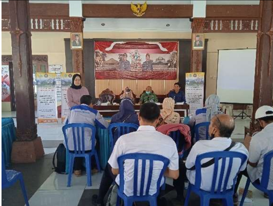
Gambar 2. FGD dengan stakeholders

Hasil evaluasi menunjukkan bahwa peserta sangat antusias untuk menerapkan teknologi informasi dalam kegiatan pemasaran. Diskusi tanya jawab mengungkapkan bahwa sebagian besar pelaku usaha masih mengandalkan sistem pemasaran konvensional melalui tengkulak, yang berakibat pada rendahnya margin keuntungan. Sebagaimana dikemukakan dalam penelitian oleh Fakultas Pertanian Universitas Gadjah Mada, "rantai pasok yang panjang menyebabkan petani hanya mendapatkan 17,5% dari harga jual akhir, sementara dengan pemasaran langsung melalui platform digital, margin dapat meningkat hingga 80%". Temuan ini mendorong peserta untuk lebih serius mengadopsi teknologi digital sebagai solusi alternatif pemasaran.