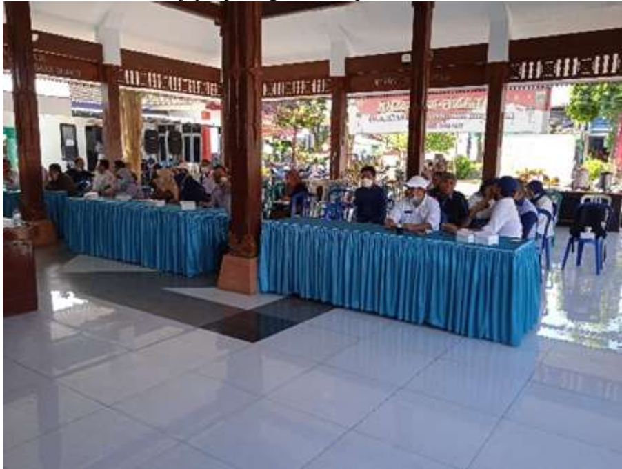
Gambar 3. FGD dengan dengan berbagai kelompok masyarakat di Kecamatan Turen, Kabupaten Malang

Model kolaborasi penta helix yang melibatkan lima elemen utama—akademisi, pemerintah, pelaku usaha, masyarakat, dan media—menjadi kerangka strategis dalam pengembangan ekonomi desa di Kecamatan Turen. (Insani et al., 2023) menjelaskan bahwa kolaborasi penta helix memungkinkan terciptanya ekosistem inovasi yang inklusif, dimana setiap elemen memiliki peran spesifik: akademisi sebagai fasilitator pengetahuan dan teknologi, pemerintah sebagai regulator dan koordinator, pelaku usaha sebagai motor ekonomi, masyarakat sebagai implementor, dan media sebagai akselerator informasi (Sumarna et al., 2025). Dalam konteks kegiatan pengabdian ini, kolaborasi penta helix telah mulai terbentuk melalui keterlibatan aktif tim akademisi Universitas Brawijaya, perangkat desa, pelaku UMKM, dan media lokal.