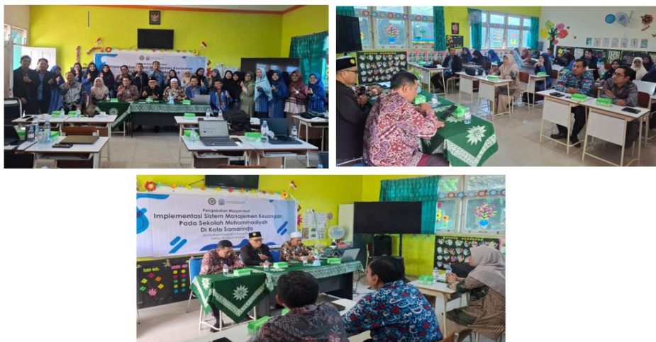
Gambar 2. Dokumentasi Kegiatan Pengabdian Masyarakat

Sebagai solusi atas ketidakteraturan tersebut, disusunlah siklus pengelolaan keuangan yang terstandar (Gambar 3). Siklus ini dimulai dari penyusunan RAPBS/RKAS yang wajib disahkan oleh Kepala Sekolah dan Komite. Alur ini mengintegrasikan jalur pengelolaan dana (SPP, BOS, Donasi) dengan mekanisme rekonsiliasi kas secara sistematis. Berbeda dengan pengabdian oleh Sintaro (2022) yang lebih fokus pada aspek teknis