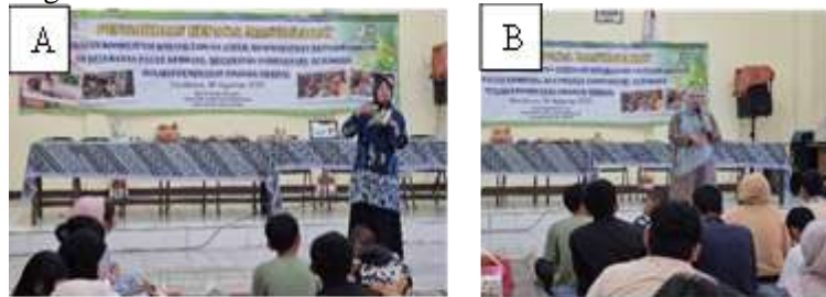
Gambar 2. A) Lokasi mitra B) Karang taruna

media atau media digital untuk alat pemasaran. Setelah mengikuti kegiatan ini pemuda karang taruna mempunyai wirausaha produk herbal, dengan kemampuannya mempunyai pendapatan sehingga perekonomian menjadi meningkat. Gambaran kondisi mitra dapat dilihat pada gambar 1A. Keberadaan karang taruna dapat dilihat pada gambar 1B