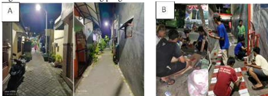
Gambar 1. Karang taruna

Bisnis jamu herbal di Indonesia berkembang pesat dan menjadi salah satu sektor ekonomi strategis. Industri jamu melibatkan lebih dari 3 juta tenaga kerja termasuk petani tanaman obat, pedagang jamu gendong, dan produsen besar seperti Sido Muncul dan Air Mancur. Nilai perdagangan jamu mencapai lebih dari Rp 5 triliun per tahun. Selain itu, pemerintah melalui program saintifikasi jamu berupaya menjadikan jamu sebagai produk farmasi berbasis lokal yang dapat bersaing di pasar global (Universitas Gadjah Mada, 2019; Fadhiela dan Lessy, 2023; Kumontov dkk., 2023) . Jamu adalah simbol warisan budaya Indonesia yang kaya akan kearifan lokal. Tradisi minum jamu tidak hanya mencerminkan hubungan manusia dengan alam tetapi juga melestarikan pengetahuan tradisional tentang pengobatan alami.