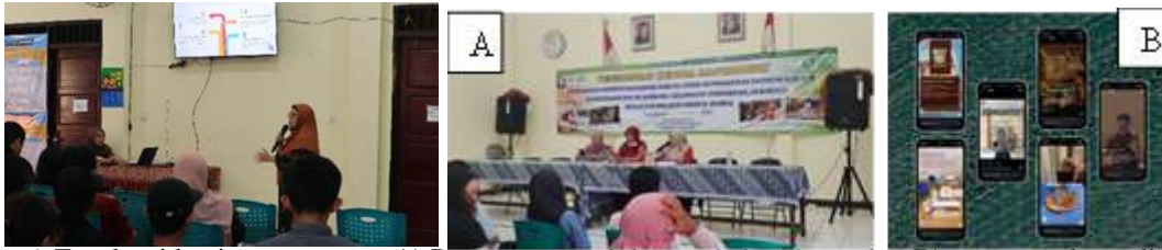
Gambar 6. Evasluasi kegiatan pengmas A) Pengmas sesuai dengan kebutuhan mitra B) pengmas dapat diaplikasikan oleh mitra

Berdasarkan hasil evaluasi pretest dan posttest terlihat bahwa terjadi peningkatan nilai dari 85,68 saat pretest meningkat menjadi 92,97 saat posttest (Gambar 4). Selain itu juga terdapat evaluasi kegiatan pengmas yang ditinjau dari dua aspek yaitu pengmas sesuai dengan kebutuhan mitra serta pengmas dapat dimanfaatkan atau diaplikasikan oleh mitra (Gambar 5A dan 5B).