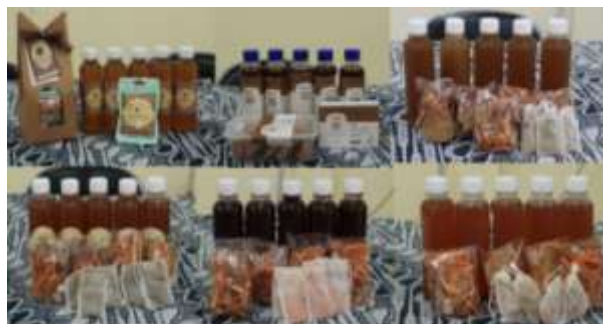
Gambar 8. Produk herbal kelompok karang taruna

Pada pertemuan ketiga tanggal 20 September 2025 diadakan evaluasi konten digital. Penilaian konten digital mencakup berbagai aspek penting, yakni relevansi konten, kejelasan pesan, kreativitas dan orisinalitas, visual dan audio, caption dan bahasa, branding produk, engagement element, serta potensi viral/shareable (Gambar 7A). Peserta telah presentasi terkait konten digital yang dibuat (Gambar 7B).