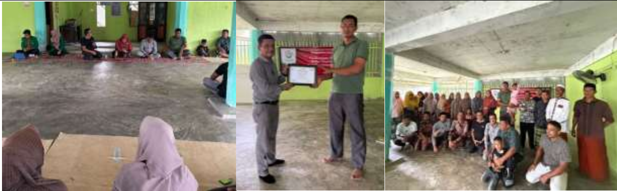
Gambar 2. Kegiatan pelatihan pengelolaan dana desa yang transparan dan akuntabel