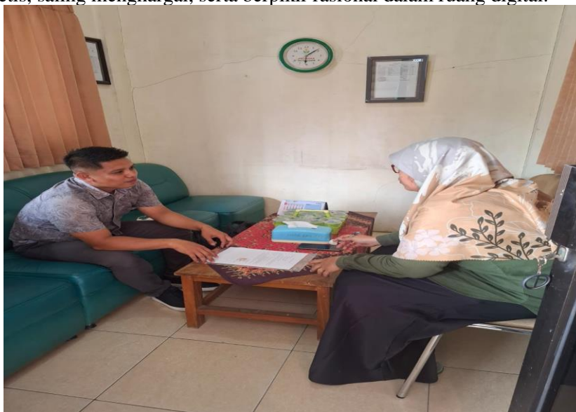
Gambar 1: Saat kunjungan ke sekolah SMK Taruna Jaya Gresik