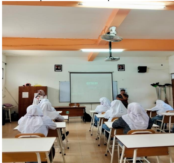
Gambar 2: Suasana kelas di sekolah SMK Taruna Jaya Gresik dalam persiapan pemberian materi pengabdian

Selain peningkatan pengetahuan dan keterampilan, kegiatan ini juga menghasilkan luaran berupa pembentukan kelompok duta literasi digital yang bertugas membuat poster digital dan kampanye edukatif di media sosial sekolah. Produk kampanye yang dihasilkan dinilai cukup baik dari sisi kreativitas dan ketepatan pesan, meskipun jangkauan penyebarannya masih terbatas pada lingkungan sekolah. Keberadaan duta literasi digital menjadi langkah awal penting untuk memperluas upaya penyadaran publik secara berkelanjutan, sejalan dengan rekomendasi yang menekankan pentingnya peer-led digital literacy dalam lingkungan pendidikan. Namun demikian, kegiatan ini juga menghadapi beberapa kendala, terutama terkait variasi kemampuan awal siswa, keterbatasan perangkat teknologi, dan waktu pelaksanaan yang relatif singkat sehingga pendalaman materi belum dapat dilakukan secara optimal.