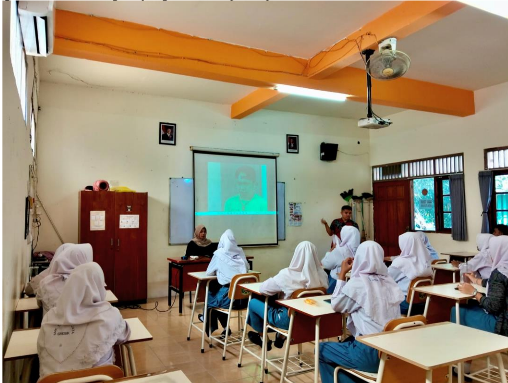
Gambar 3: Pemberian materi pengabdian

melakukan edukasi publik terkait keamanan digital, etika berpendapat, dan teknik verifikasi konten. Program ini juga memiliki potensi diperluas melalui kolaborasi lintas sekolah dan pemanfaatan media digital seperti video edukatif, microlearning , dan podcast. Dengan demikian, kegiatan pengabdian ini tidak hanya memberikan dampak jangka pendek berupa peningkatan literasi demokrasi digital siswa, tetapi juga membuka jalan untuk penguatan ketahanan demokrasi dalam jangka panjang melalui pemberdayaan generasi muda sebagai aktor literasi digital yang kritis dan partisipatif.