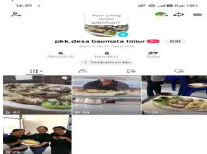
Gambar 6. Pembuatan Akun TikTok

Gambar 5 merupakan kegiatan Materi Pengolahan pada PKM bagi kelompok PKK desa wisata Baumata Timur, Pemanfaatan ragi Lokal pada Pangan dilaksanakan langsung oleh ketua Tim Pengabdian yaitu Regina Ilse Marcelina BanoEt,SP.,MP.Mitra sangat antusias bahkan mampu melakukan duplikasi metode dan menghasilkan diversifikasi produk.