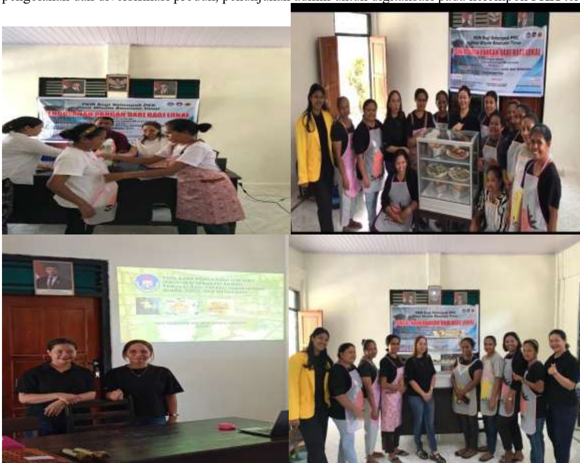
Gambar 10. Hasil Dokumentasi Akhir Kegiatan

Selama kegiatan PKM Tahun anggaran 2025 ini ,luaran yang dihasilkan oleh tim Pengabdian adalah pemberitaan kegiatan di media masa elektronik dan cetak,wawancara kegiatan di RRI Pro 4 ketua diundang sebagai pemateri, video diunggah di youtube Lembaga, draft artikel, peningkatan ketrampilan mitra pada pengolahan dan diversifikasi produk, penunjukan admin untuk digitalisasi pada kelompok PKK tersebut.