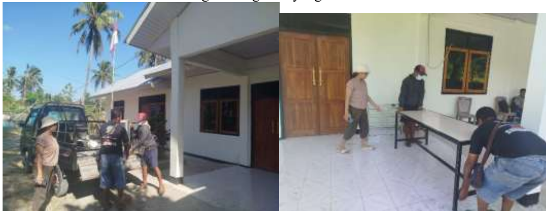
Gambar 2. Pengantaran Barang

Gambar 1 merupakan kegiatan sosialisasi awal pada kepala desa sebagai pimpinan wilayah. Tim melakukan konsolidasi dan informasi mengenai kegiatan yang lolos dana Kemendiktisaintek.