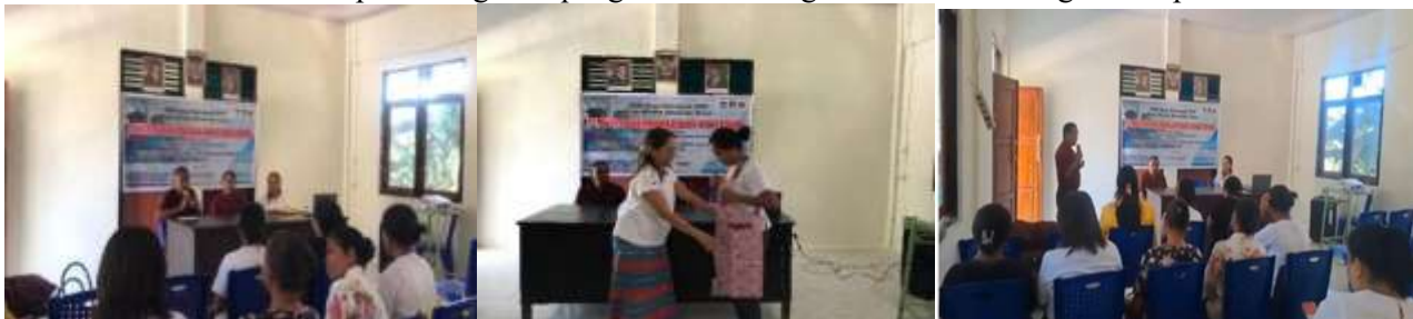
Gambar 3. Pelaksanaan kegiatan

Gambar 2 diatas merupakan kegiatan pengantaran barang oleh Ketua tim bagi kelompok ibu PKK