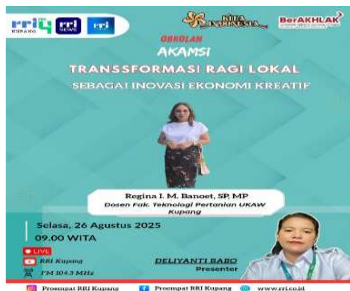
Gambar 7. Hasil Edit Video