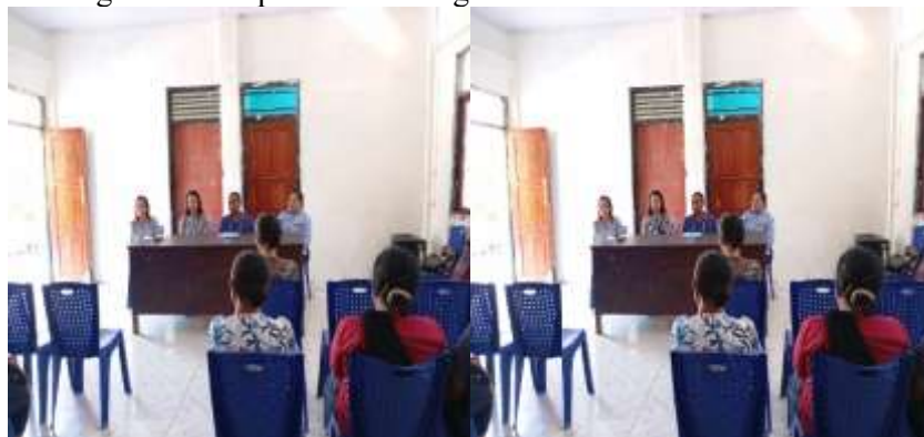
Gambar 1. Kegiatan Sosialisasi Awal

Hasil pelaksanaan kegiatan ditampilkan melalui gambar dibawah ini :