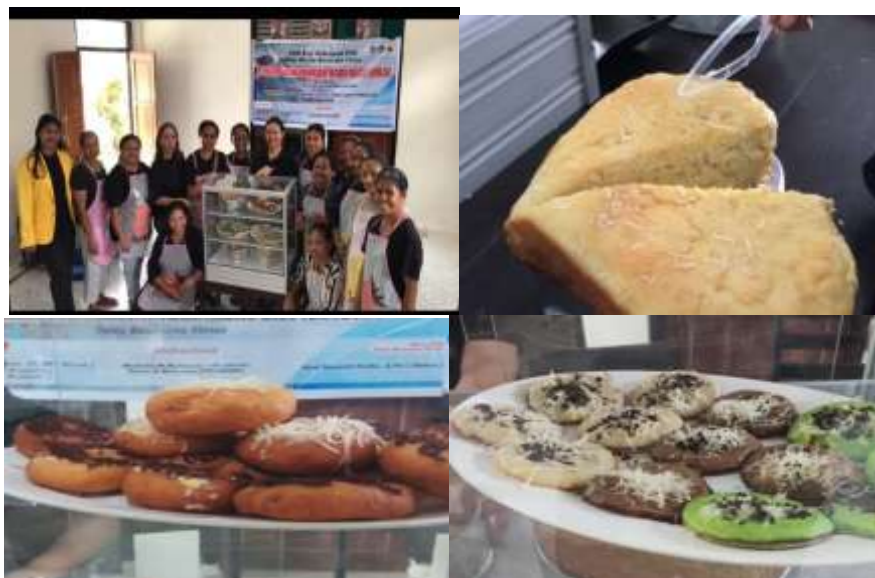
Gambar 8. produk serabi ,donat,roti yang dihasilkan saat pelatihan.

Klaim produk yang akan dihasilkan setelah kegiatan PKM oleh pelaksana seperti pada gambar-gambar berikut: