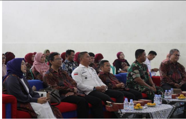
Gambar 3. Masyarakat dan aparat Desa Simpen Kaler dalam mengikuti kegiatan.

Gambar 3 di atas memperlihatkan tingginya partisipasi aktif warga yang memadati aula pertemuan. Keberagaman peserta yang hadir, mulai dari tokoh masyarakat hingga ibu-ibu rumah tangga, mengindikasikan bahwa isu pinjaman online dan Bank Emok merupakan permasalahan lintas sektoral yang meresahkan semua kalangan. Antusiasme yang terekam dalam dokumentasi tersebut juga menjadi bukti validasi bahwa metode penyuluhan partisipatif yang diterapkan tim pengabdian berhasil membangun ruang dialog yang inklusif.