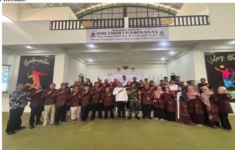
Gambar 7. Foto bersama peserta dan tim pengabdian

Tingginya antusiasme dan fokus pada langkah preventif menunjukkan bahwa kegiatan pengabdian ini berhasil mencapai tujuan utamanya: transformasi kesadaran. Dari dialog yang intensif, lahir kesepahaman kolektif di kalangan peserta, termasuk perwakilan aparat dan tokoh masyarakat, untuk secara aktif menyebarkan informasi bahaya Riba ini dan menolak praktik pinjaman ilegal di lingkungan desa mereka. Komitmen ini menjadi modal sosial yang esensial dalam mendukung pembangunan desa yang lebih aman, mandiri, dan sejahtera di masa mendatang. Selain itu, sebagai tindak lanjut, peningkatan keterampilan ( income-generating training ) juga dianggap penting sebagai solusi jangka panjang untuk mengurangi desakan kebutuhan modal.