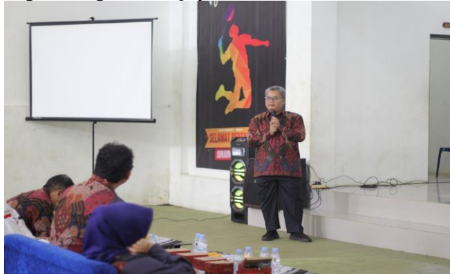
Gambar 5. Prof. Dr. H. Mohamad Anton Athoillah, MM mengupas praktik pinjaman ilegal dalam konteks kehidupan sosial dan ekonomi masyarakat.

modal utama kehidupan masyarakat perdesaan. Oleh karena itu, langkah preventif yang diupayakan dalam pengabdian ini merupakan bagian integral dari upaya restorasi keamanan sosial desa.