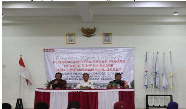
Gambar 2. Sambutan Ketua Program Studi Hukum Ekonomi Syariah

Rangkaian acara kemudian dilanjutkan dengan sambutan dari pihak UIN Sunan Gunung Djati Bandung yang diwakili oleh Ketua Program Studi Hukum Ekonomi Syariah. Dalam sambutannya, beliau menyampaikan rasa terima kasih dan apresiasi mendalam atas penerimaan yang sangat hangat dari seluruh jajaran pemerintahan desa serta warga masyarakat. Ketua Program Studi mengutarakan bahwa kehadiran tim pengabdian merupakan bentuk respons nyata dunia akademisi terhadap permasalahan krusial yang tengah menjerat masyarakat, yakni maraknya pinjaman online ilegal dan praktik Bank Emok.