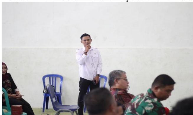
Gambar 6. Salah seorang peserta secara aktif mengajukan pertanyaan kritis kepada tim pengabdian.

Tingkat antusiasme yang tinggi dalam forum diskusi ditujukan pada pertanyaan-pertanyaan yang bersifat forward-looking dan mendalam, yang berfokus pada langkah-langkah konkret untuk terhindar dari jeratan utang di kemudian hari. Hal ini menunjukkan bahwa fokus masyarakat telah bergeser dari sekadar keluhan menjadi upaya serius dalam merumuskan mekanisme pertahanan diri secara kolektif.