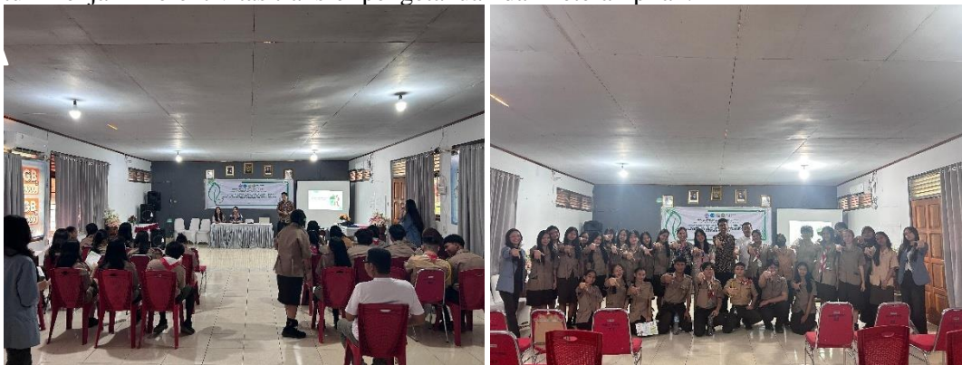
Gambar 4. (A & B) Pelaksanaan sosialisasi dan edukasi lingkungan kepada anggota Green Community SMA Negeri 7 Manado

Program pengabdian masyarakat ini dilaksanakan secara komprehensif di SMA Negeri 7 Manado dengan melibatkan siswa anggota Green Community sebagai mitra strategis. Implementasi kegiatan dilakukan melalui pendekatan Participatory Learning and Action (PLA) yang terbagi menjadi tiga tahapan utama untuk menjamin efektivitas transfer pengetahuan dan keterampilan.