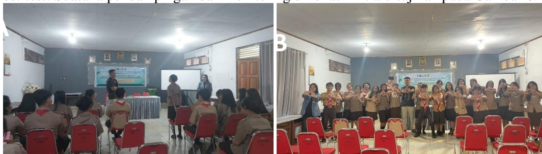
Gambar 6. (A & B) Proses pendampingan dan monitoring berkala

Tahap ketiga adalah Pendampingan dan Evaluasi. Pasca pelatihan, tim pelaksana melakukan pendampingan berkala untuk memonitor progres produksi mandiri siswa. Monitoring dilakukan baik secara langsung maupun daring melalui grup WhatsApp untuk memastikan kendala teknis dapat segera teratasi. Pada akhir kegiatan, dilakukan evaluasi kualitas produk fisik dan pengukuran peningkatan kompetensi melalui post-test . Suasana pendampingan dan monitoring di lokasi mitra disajikan pada Gambar 6.