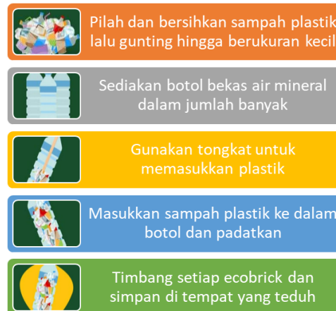
Gambar 2. Proses Pembuatan Ecobrick

gunting untuk merajang plastik ( cutting ) dan tongkat kayu atau bambu sebagai alat pemadat ( packer ) untuk memastikan densitas botol terpenuhi.