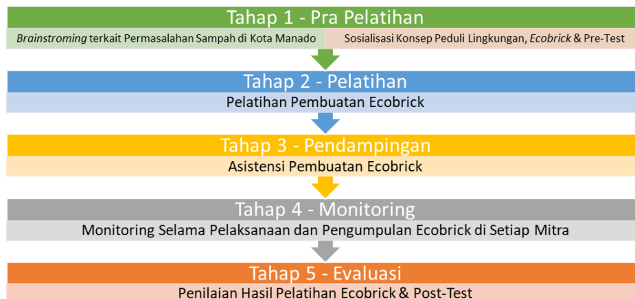
Gambar 3. Tahapan Pelaksanaan

Pasca pelatihan, dilakukan pendampingan untuk memantau konsistensi produksi mandiri oleh anggota komunitas. Evaluasi akhir dilakukan melalui post-test untuk mengukur peningkatan pemahaman teknis, serta Quality Control (QC) fisik terhadap produk Ecobrick yang dihasilkan. Botol yang lolos uji densitas akan disimpan sebagai inventaris bank sampah sekolah untuk proyek lanjutan. Post-test dilaksanakan pada 10 Oktober.