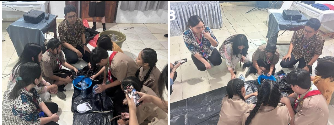
Gambar 5. (A & B) Kegiatan pelatihan teknis pembuatan Ecobrick di mana siswa mempraktikkan teknik pemadatan sampah plastik.

Tahap ketiga adalah Pendampingan dan Evaluasi. Pasca pelatihan, tim pelaksana melakukan pendampingan berkala untuk memonitor progres produksi mandiri siswa. Monitoring dilakukan baik secara langsung maupun daring melalui grup WhatsApp untuk memastikan kendala teknis dapat segera teratasi. Pada akhir kegiatan, dilakukan evaluasi kualitas produk fisik dan pengukuran peningkatan kompetensi melalui post-test . Suasana pendampingan dan monitoring di lokasi mitra disajikan pada Gambar 6.