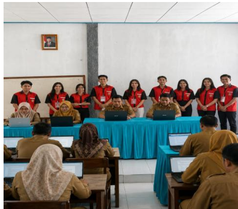
Gambar 4: Foto setelah sesi pelatihan selesai.

Tabel 2 menunjukkan bahwa rata-rata pemahaman guru meningkat dari 20,0% menjadi 85,7% setelah mengikuti pelatihan. Seluruh guru (100%) kini mengetahui prosedur penanganan kasus perundungan, dibandingkan hanya 28,6% sebelumnya. Peningkatan ini sangat signifikan karena guru merupakan ujung tombak penanganan perundungan di sekolah.