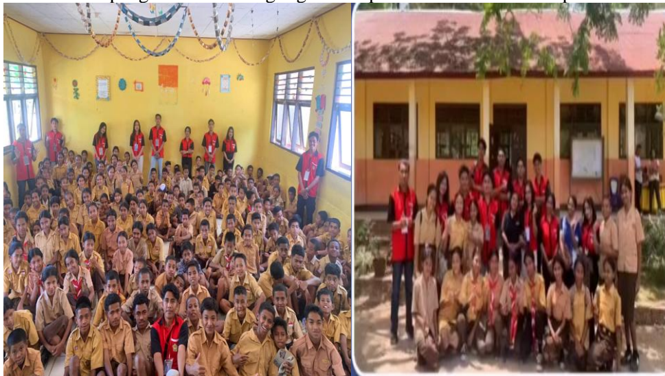
Gambar 2 dan 3: Foto sebelah kiri dilakukan setelah sosialisasi selesai, sementara foto sebelah kanan merupakan foto sebelum sosialisasi dilaksanakan.

Tabel 1 menunjukkan peningkatan pemahaman siswa yang signifikan pada seluruh indikator setelah mengikuti sosialisasi. Rata-rata pemahaman siswa meningkat dari 13,3% pada pre-test menjadi 78,3% pada post-test, dengan rata-rata peningkatan sebesar 65%. Peningkatan tertinggi terjadi pada indikator pengetahuan tentang UU No. 35 Tahun 2014 tentang Perlindungan Anak, yang melonjak dari 3,3% menjadi 73,3% (peningkatan 70%). Hal ini menunjukkan bahwa sosialisasi hukum yang interaktif dan kontekstual efektif dalam mentransfer pengetahuan tentang regulasi kepada siswa di daerah terpencil.