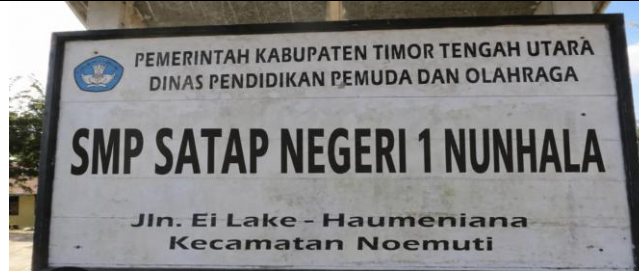
Gambar 1: Foto SMP Satap Negeri 1 Nunhala