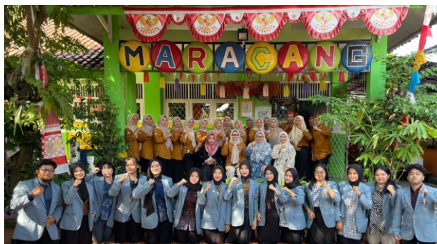
Gambar 1. Lokasi SDN Maracang, Purwakarta

Permasalahan lainnya adalah belum terinternalisasinya nilai aman dan bermartabat sebagai budaya sekolah. Masih ditemukan praktik disiplin yang keras, kurangnya edukasi mengenai hak anak, serta interaksi yang belum sepenuhnya berorientasi pada penghargaan terhadap martabat peserta didik. Hal ini menyebabkan anak belum merasa sepenuhnya aman secara fisik maupun psikologis ketika berada di lingkungan sekolah. Keseluruhan kondisi tersebut menunjukkan bahwa SDN Maracang Purwakarta membutuhkan intervensi berupa program edukasi, pelatihan, dan refleksi mendalam untuk memperkuat pemahaman, sikap, serta komitmen seluruh warga sekolah dalam mencegah kekerasan sejak dini dan mewujudkan sekolah yang aman serta bermartabat.