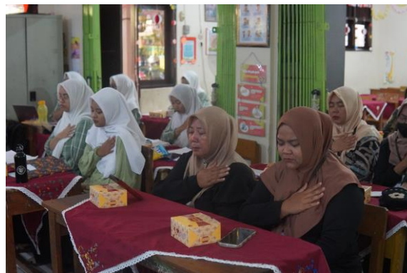
Gambar 3. Sesi Refleksi Diri

Selain sesi pematerian, kegiatan dilanjutkan dengan sesi refleksi diri (relaksasi diri) yang diikuti oleh guru, orang tua, dan mahasiswa. Sesi ini dipandu langsung oleh narasumber dengan menggunakan teknik meditasi reflektif untuk membantu peserta melakukan proses self-forgiveness (pengampunan diri), melepaskan beban emosional, serta meningkatkan kesadaran dan kesehatan mental. Narasumber mengajak peserta menelusuri kembali pengalaman-pengalaman yang menimbulkan rasa bersalah, tekanan batin, maupun kelelahan mental, kemudian perlahan mengikhlaskan dan melepaskannya sebagai bentuk pemulihan diri ( healing ).