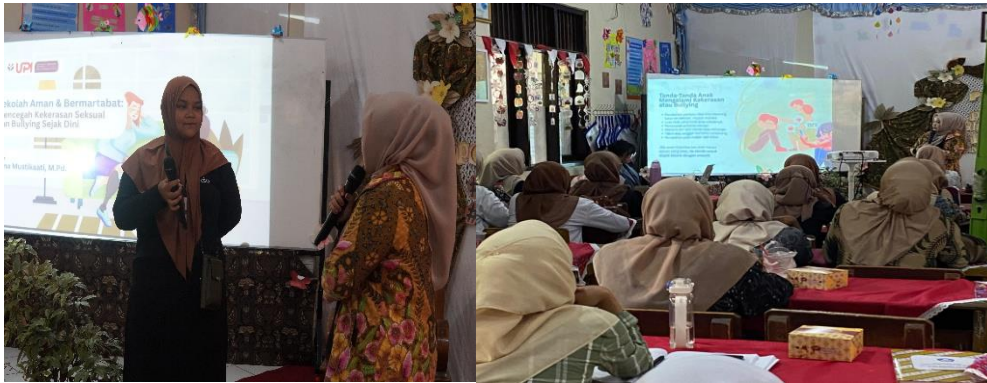
Gambar 2. Sesi Pematerian (a) Sesi tanya jawab bersama peserta (b) Pematerian mengenai pencegahan kekerasan seksual dan bullying.

orang tua sebagai garda terdepan dalam pencegahan dan penanganan kasus, dengan menampilkan strategi yang etis, profesional, dan empatik. Melalui studi kasus, simulasi, dan contoh nyata di lapangan, guru beserta orang tua diajak memahami bagaimana merespons laporan siswa, melakukan komunikasi aman, menjaga kerahasiaan, serta memastikan bahwa setiap tindakan yang diambil berorientasi pada perlindungan dan pemulihan psikologis anak. Pemaparan tersebut membuat peserta semakin menyadari bahwa pencegahan kekerasan seksual bukan hanya soal pengetahuan, tetapi juga tentang kepekaan emosional, kesiapan mental, dan komitmen untuk membangun budaya sekolah yang aman dan bermartabat.