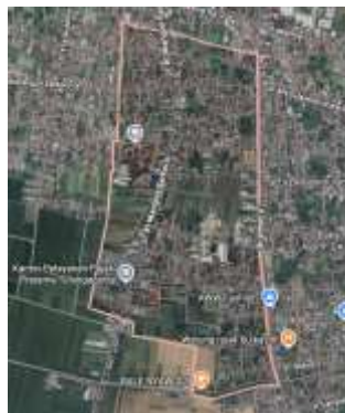
Gambar 1. Peta Lokasi Desa Beji

Pengabdian ini dilaksanakan dengan Dusun Krajan Desa Beji Kecamatan Boyolangu Kabupaten Tulungagung.