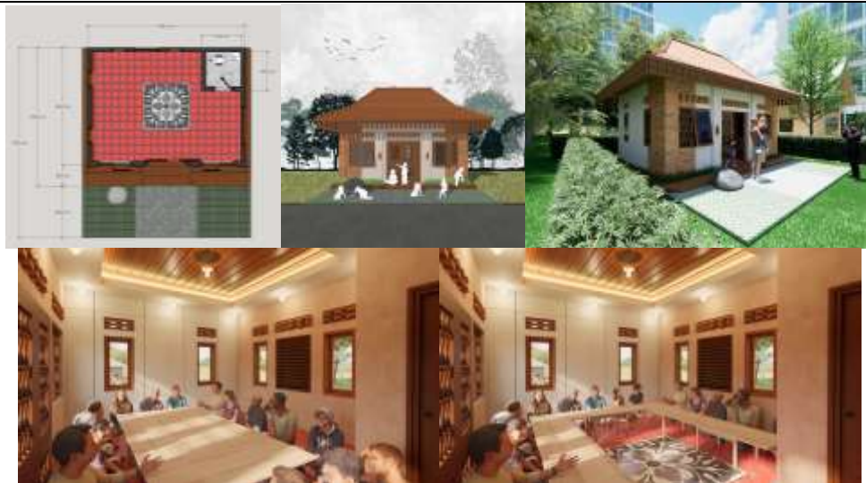
Gambar 3. Denah, Tampak, Perspektuf, dan Interior Balai Warga