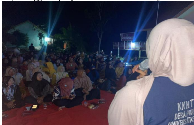
Gambar 4. Pertemuan Kedua Di Balai Desa

Percakapan ringan ini justru menjadi sumber informasi yang sangat berharga. Melalui pengamatan langsung dan cerita warga, penulis dapat memahami situasi keluarga dan kondisi emosional anak yang sering terjadi di lingkungan tersebut. Informasi ini kemudian dijadikan dasar dalam merancang penyampaian materi penyuluhan pada malam hari, sehingga isi penyuluhan benar-benar menjawab kebutuhan warga.