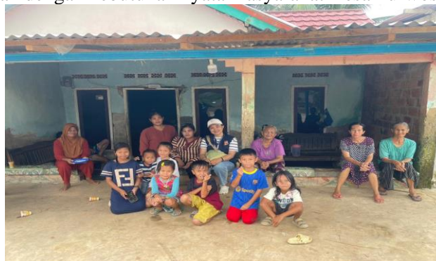
Gambar 3. Pertemuan Pertama

Pelaksanaan kegiatan penyuluhan dilakukan melalui dua bentuk pendekatan, yaitu interaksi sosial yang bersifat informal pada siang hari dan kegiatan penyuluhan utama secara lebih terstruktur pada malam hari. Kedua kegiatan ini dirancang agar saling melengkapi: interaksi siang hari digunakan untuk menggali kondisi emosional anak dan pola pengasuhan orang tua secara langsung, sedangkan penyuluhan malam hari digunakan sebagai wadah untuk memberikan pemahaman, pengetahuan, serta keterampilan yang bisa diterapkan oleh para orang tua di rumah. Dengan cara ini, penyuluhan tidak hanya menjadi kegiatan informatif, tetapi juga relevan dengan kebutuhan nyata masyarakat Desa Purwosari.