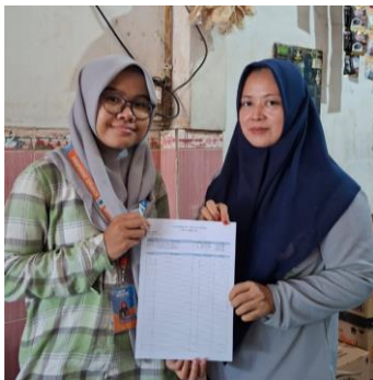
Gambar 3. Dokumentasi Pendampingan Pencatatan Secara Manual

Untuk memastikan pendampingan yang dilakukan berjalan secara efektif, seluruh kegiatan dilakukan melalui kunjungan langsung ( door to door ) ke rumah atau tempat usaha masing-masing seperti pada Gambar 1. Pendekatan ini dipilih agar pendamping bisa melihat langsung kondisi usaha, harga bahan baku, proses produksi, hingga cara pelaku usaha menentukan harga jual. Selain itu, salah satu pelaku UMKM yang menjual pentol dan es cao juga menyampaikan bahwa, “Saya lebih suka didatangi langsung, kalau dikumpulkan di satu tempat saya sering tidak ada waktu untuk datang, karena harus jualan juga. Kalau didatangi ke tempat saya bisa sambil jualan”.