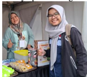
Gambar 2. Pendampingan Secara Langsung

Setelah dilakukan identifikasi kebutuhan masing-masing pelaku usaha. Dari 9 UMKM, terdapat 5 UMKM memilih pencatatan secara manual karena merasa lebih nyaman dengan cara menulis. UMKM yang memilih metode ini umumnya memiliki usaha rumahan dengan aktivitas sederhana sehingga mereka lebih menyukai kegiatan yang tidak memerlukan perangkat. Sedangkan 4 UMKM lainnya memilih pencatatan digital. Mereka merasa bahwa templat keuangan yang dibuat oleh pendamping mudah dipahami dan digunakan karena rumus otomatis bisa menghitung laba, HPP, dan BEP tanpa mereka perlu menghitung secara manual. Sehingga, pengguna templat hanya perlu mengikuti instruksi yang ada pada spreadsheet.