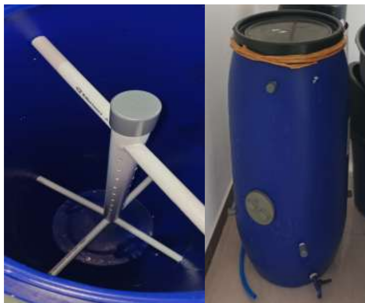
Gambar 5. Fermentor sampah organik

Selain itu, pada akhir dari program pengabdian masyarakat ini, Tim PKM EDU juga membuat alat fermentor sebagaimana pada Gambar 5 dengan ukuran yang lebih besar dibandingkan pada saat percobaan sebelumnya.