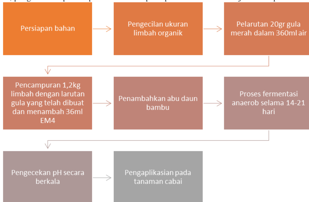
Gambar 2. Tahapan pembuatan pupuk organik cair dari sampah rumah tangga dengan penambahan abu sekam padi

pemisahan residu dan cairan dengan penyaringan. Cairan filtrat yang diperoleh merupakan pupuk organik cair (POC) yang diberi nama PUCASARI, sementara residu dapat juga dimanfaatkan sebagai kompos. Pada pengabdian ini, pengamatan aplikasi produk dibatasi pada pemanfaatan POC saja terhadap tanaman cabai.