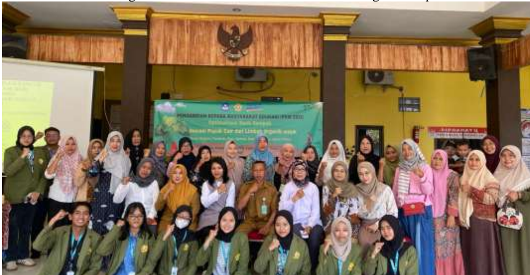
Gambar 4. Dokumentasi bersama pada kegiatan sosialisasi

produk agar dapat menjadi salah satu produk unggul yang dapat menjadi peningkatan sumber ekonomi masyarakat Desa Segoro Tambak. Pada akhir kegiatan sosialisasi, peserta selanjutnya diberi pertanyaan lisan atau evaluasi untuk penguatan terhadap materi yang telah disampaikan. Dari beberapa pertanyaan yang disampaikan secara langsung oleh Tim PKM EDU, peserta mampu memberikan jawaban dan penjelasan yang komprehensif. Dengan demikian, dapat dikatakan bahwa kegiatan sosialisasi yang telah dilakukan efektif dalam meningkatkan pemahaman masyarakat terkait pengelolaan sampah menjadi pupuk organik cair. Adapun salah satu dokumentasi dari kegiatan sosialisasi tersebut diabadikan sebagaimana pada Gambar 4.