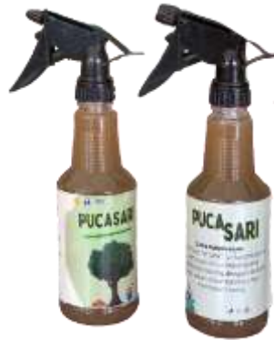
Gambar 3. Produk pupuk cair organik PUCASARI

Hasil pengamatan yang dilakukan pada pengaplikasian PUCASARI terhadap tanaman cabai disajikan pada Tabel 1. Berdasarkan data pada tabel tersebut terlihat bahwa tanaman cabai yang diberi PUCASARI memiliki pertumbuhan yang lebih cepat dibandingkan tanaman kontrol. Tanaman cabai yang diberi PUCASARI memiliki rata-rata peningkatan tinggi tanaman sebesar \pm 1,3 cm setiap minggu yaitu dari 6,5 cm pada minggu pertama, kemudian bertumbuh menjadi 7,6 cm pada minggu kedua, hingga menjadi 9,2 cm pada minggu ketiga. Sedangkan tanaman kontrol hanya mengalami peningkatan rata-rata \pm 0,85 cm yaitu dari 5 cm menjadi 6,7 cm. Hasil pengamatan tersebut sejalan dengan pengamatan yang dilakukan oleh (Driantama et al., 2021) yang melaporkan pertumbuhan tinggi tanaman cabai pada umur dua minggu sebesar 7,4 cm pada perlakuan yang diberi pupuk organik cair sementara pada tanaman kontrol hanya 3,88 cm.