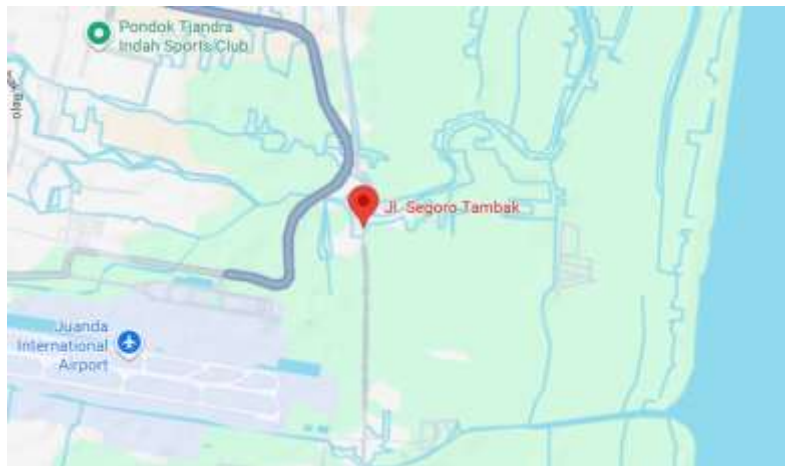
Gambar 1. Lokasi Desa Segoro Tambak

Sampah yang dihasilkan di Desa Segoro Tambak umumnya dikelola dengan melakukan pembakaran dengan menggunakan insinerator, akan tetapi dengan jumlah yang semakin meningkat pengelolaan tersebut masih kurang, akibatnya terjadi timbunan sampah yang cenderung dominan berakhir di TPS ataupun TPA. Dalam jangka waktu yang lama, hal tersebut tentu akan dapat menimbulkan permasalahan yang serius seperti memperbesar terjadinya banjir, karena timbunan sampah tersebut dapat mengganggu penyerapan air tanah dan menghambat saluran air. Terlebih kondisi daerah Segoro Tambak termasuk wilayah pesisir yang rawan banjir (Gambar 1). Dengan demikian perlu dilakukan pengolahan sampah rumah tangga agar membantu mengurangi kapasitas sampah yang harus dibuang ke TPS atau TPA dalam rangka mengurangi potensi banjir dikemudian hari.