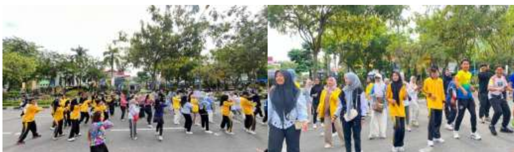
Gambar 4. Senam sehat bersama dengan masyarakat

Tim juga melakukan briefing internal untuk memastikan setiap anggota memahami alur kegiatan, materi yang akan disampaikan, serta strategi komunikasi kepada masyarakat. Selain itu, dilakukan simulasi singkat agar penyampaian materi berjalan efektif meskipun lingkungan ramai. Pelaksanaan edukasi radiasi dilakukan secara langsung kepada masyarakat yang hadir di area Care Free Day. Kegiatan berlangsung dalam bentuk penyuluhan singkat, diskusi, serta pembagian leaflet informasi serta kegiatan diakhiri dengan senam sehat bersama.