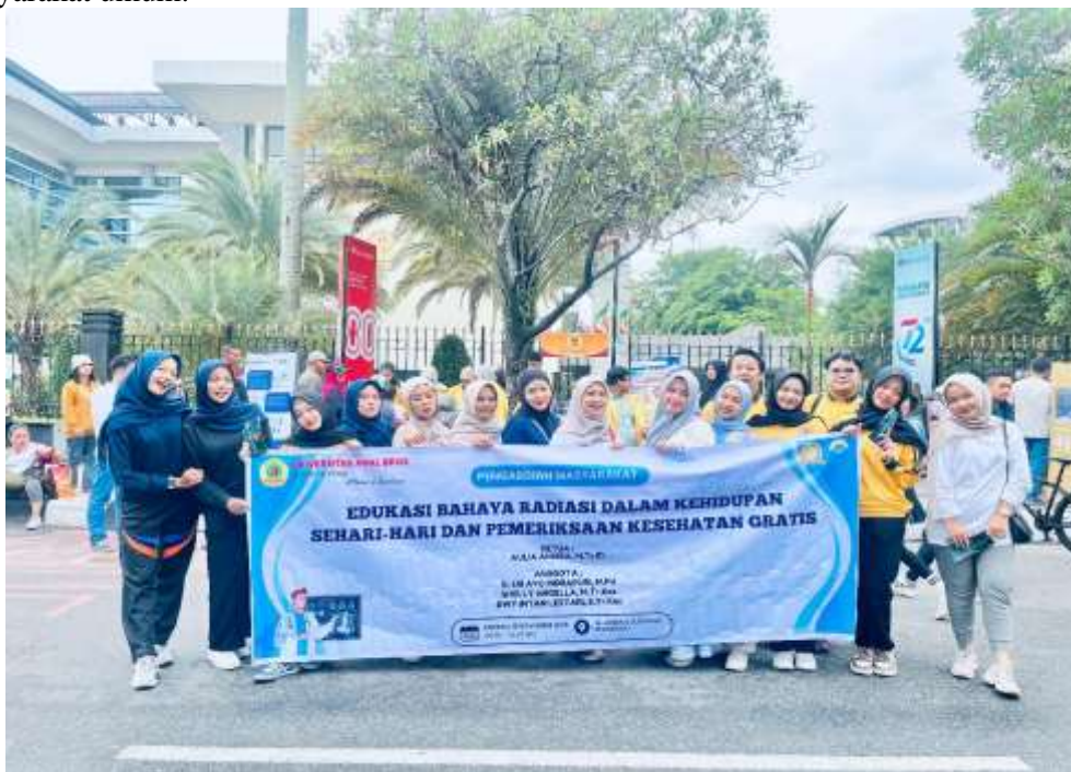
Gambar 1. Lokasi Kegiatan area CFD