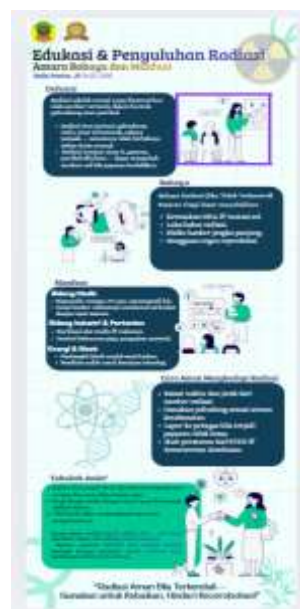
Gambar 3. Banner penyuluhan radiasi dikehidupan sehari-hari

Tim juga melakukan briefing internal untuk memastikan setiap anggota memahami alur kegiatan, materi yang akan disampaikan, serta strategi komunikasi kepada masyarakat. Selain itu, dilakukan simulasi singkat agar penyampaian materi berjalan efektif meskipun lingkungan ramai. Pelaksanaan edukasi radiasi dilakukan secara langsung kepada masyarakat yang hadir di area Care Free Day. Kegiatan berlangsung dalam bentuk penyuluhan singkat, diskusi, serta pembagian leaflet informasi serta kegiatan diakhiri dengan senam sehat bersama.