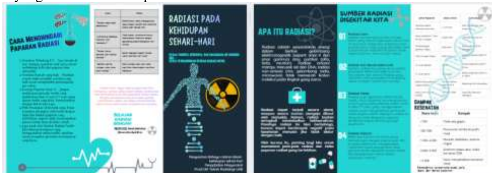
Gambar 2. Leaflet penyuluhan radiasi dikehidupan sehari-hari

penjadwalan, pembagian tugas tiap anggota, dan koordinasi dengan pihak pengelola Care Free Day. Tim juga menyiapkan media edukasi berupa leaflet, poster, dan materi penjelasan singkat mengenai radiasi medis serta penggunaannya dalam layanan kesehatan. Tahap persiapan dilakukan dengan menyiapkan seluruh kebutuhan teknis, seperti penyediaan alat peraga, pencetakan leaflet, dan pengecekan lokasi yang akan digunakan. Berikut media edukasi yang telah dibuat tim peneliti: