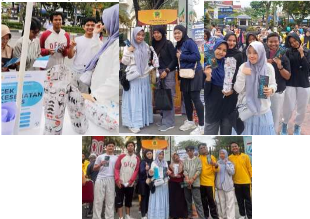
Gambar 6. Pemberian hadiah dari pertanyaan leaflet dan pemaparan

Kemampuan masyarakat dalam menjelaskan ulang materi menunjukkan bahwa transfer pengetahuan telah berjalan efektif, memenuhi standar outcome-based dalam pengabdian kepada masyarakat yang menjadi acuan DIKTI. Pelaksanaan di area CFD juga terbukti efisien dalam memperluas jangkauan edukasi dan meningkatkan efektivitas penyampaian informasi.