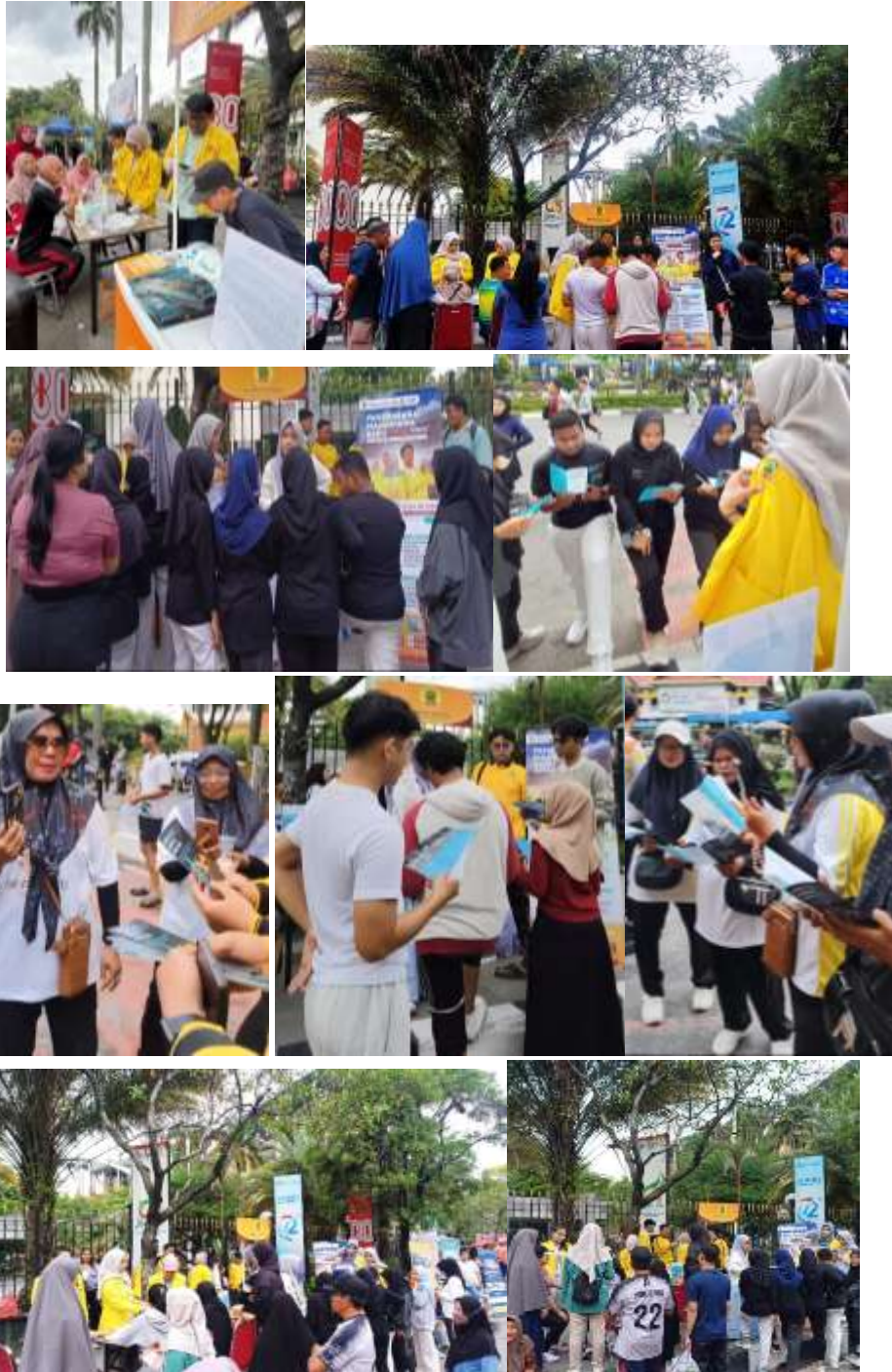
Gambar 5. Pelaksanaan cek kesehatan gratis dan penyuluhan

Sebelum kegiatan senam bersama masyarakat diberikan pemahaman mengenai apa itu radiasi, manfaat radiasi dalam dunia medis, risiko yang mungkin terjadi, serta pentingnya prosedur keamanan radiasi. Tim juga membagi pengunjung ke beberapa kelompok kecil untuk memudahkan penyampaian informasi dalam situasi yang ramai. Evaluasi dilakukan secara langsung melalui percakapan dan umpan balik singkat dari masyarakat. Sebagian besar peserta menyatakan bahwa informasi yang disampaikan sangat bermanfaat dan menambah wawasan mereka mengenai radiasi medis. Masyarakat mengaku sebelumnya memiliki pemahaman yang minim mengenai radiasi dan merasa kegiatan ini membantu menghilangkan stigma negatif tentang pemeriksaan radiologi. Feedback ini menunjukkan bahwa kegiatan edukasi berjalan efektif dan sesuai kebutuhan masyarakat.