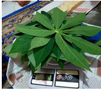
Gambar 2. Limbah Daun Singkong yang Belum Diolah dan Dimanfaatkan