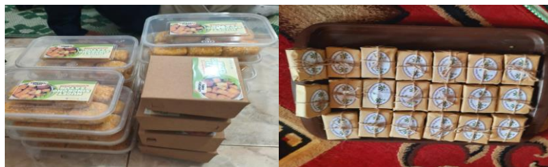
Gambar 5. Produk nugget singkong sayur dan sabun padat dari ekstrak daun singkong sebagai luaran kegiatan pengabdian kepada masyarakat di Desa Genengan, Kecamatan Jumantono, Kabupaten Karanganyar.

Indikator keberhasilan kegiatan ditunjukkan melalui tingginya partisipasi dan keterlibatan aktif peserta selama pelaksanaan kegiatan. Seluruh peserta mampu mengikuti tahapan praktik dengan baik dan menghasilkan produk sesuai dengan contoh yang diberikan. Umpan balik dari peserta menunjukkan adanya ketertarikan untuk mengembangkan produk olahan singkong sebagai peluang usaha skala rumah tangga. Temuan tersebut sejalan dengan Darodjat, Maulana, & Suryamah (2024) yang menyatakan bahwa keterlibatan aktif mitra menjadi kunci keberhasilan program pengabdian masyarakat.