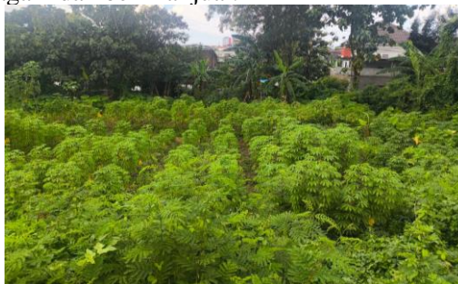
Gambar 1. Potensi Lahan Komoditas Singkong di Wilayah Desa Genengan