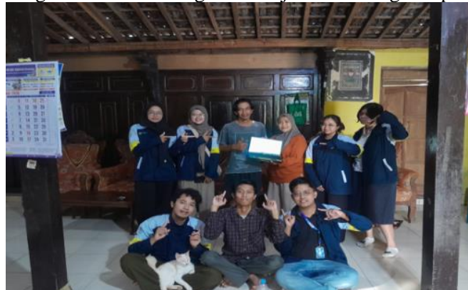
Gambar 4. Proses pembuatan NIB bersama salah satu warga Desa Genengan

Keberhasilan metode pengabdian didukung oleh keterlibatan narasumber praktisi usaha olahan singkong berupa gethuk dari wilayah Tawangmangu, Kabupaten Karanganyar. Penyampaian materi berbasis pengalaman nyata memberikan gambaran konkret mengenai peluang usaha yang dapat dikembangkan dari singkong. Pendekatan tersebut efektif dalam meningkatkan motivasi peserta karena mitra memperoleh contoh langsung keberhasilan usaha berbasis komoditas lokal. Perubahan pola pikir masyarakat terlihat dari meningkatnya minat untuk mengembangkan produk olahan bernilai tambah. Dampak signifikan dari kegiatan ini ditunjukkan melalui munculnya inisiatif usaha baru dari salah satu warga desa yang mulai merintis usaha olahan singkong setelah mengikuti kegiatan. Inisiatif tersebut mencerminkan perubahan peran mitra dari penerima manfaat menjadi pelaku usaha. Tim pengabdian memberikan dukungan lanjutan melalui pendampingan pengurusan Nomor Induk Berusaha (NIB) sebagai langkah awal legalitas usaha. Pendampingan legalitas menjadi faktor penting dalam mendukung keberlanjutan usaha agar dapat berkembang secara terarah.