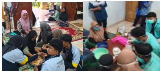
Gambar 3. Proses pembuatan nugget singkong sayur dan sabun padat dari ekstrak daun singkong bersama KWT Sekar Arum

Pelaksanaan sosialisasi dan pelatihan pembuatan sabun padat dari ekstrak daun singkong memberikan dampak positif terhadap pemanfaatan limbah pertanian. Peserta mampu mengikuti proses ekstraksi, pencampuran bahan, pencetakan, hingga pengemasan sabun dengan memperhatikan aspek keselamatan kerja. Kegiatan ini membuka wawasan peserta bahwa limbah daun singkong dapat diolah menjadi produk nonpangan bernilai guna yang berpotensi menambah pendapatan rumah tangga. Pendekatan tersebut turut memperkenalkan pemanfaatan sumber daya secara lebih optimal dan berkelanjutan.