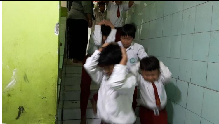
Gambar 4. Simulasi Mitigasi Bencana Gempa Bumi

Sebelum pelaksanaan simulasi gempa bumi, siswa-siswi diberikan pengenalan terhadap rambu-rambu jalur evakuasi gempa bumi. Hal ini bertujuan agar siswa tidak kebingungan ketika melakukan simulasi bencana. Selain itu, agar siswa dapat mempratikkan simulasi bencana gempa bumi dengan baik dan benar. Kegiatan pengenalan rambu-rambu jalur evakuasi yang sudah terpasang di SD Bustanul Huda.