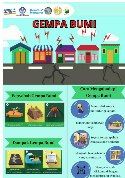
Gambar 2. Poster sosialisasi bantuan bencana gempa bumi