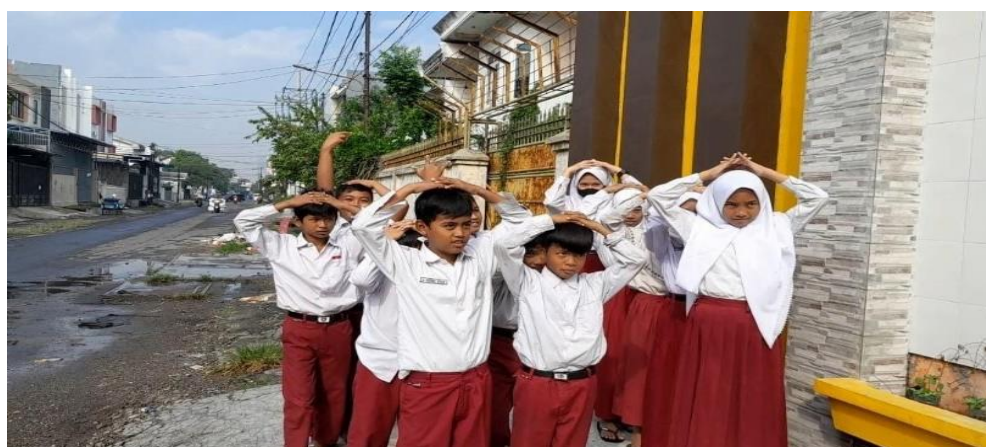
Gambar 1. Kegiatan Simulasi Mitigasi Bencana Gempa Bumi