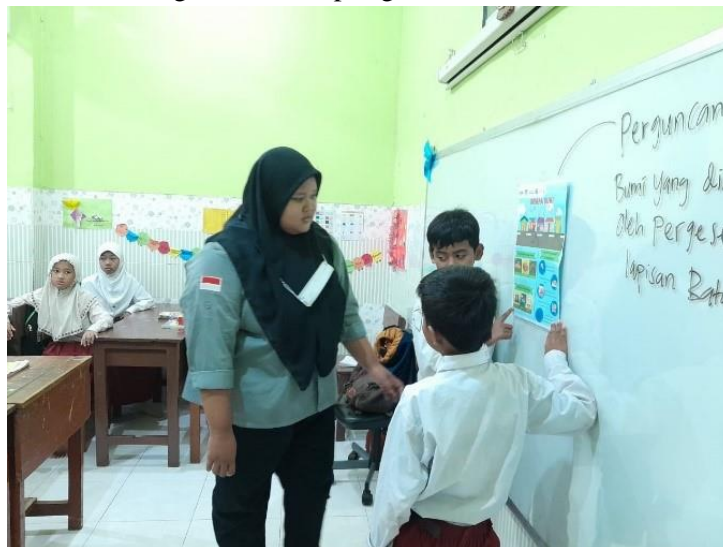
Gambar 3. Sosialisasi Kepada Siswa-siswi Kelas 5 SD Bustanul Huda Surabaya

Pada hari Selasa, 14 Juni 2022 telah dilakukan kegiatan sosialisasi dan simulasi mitigasi gempa di SD Bustanul Huda Surabaya untuk meningkatkan kesiapsiagaan siswa.