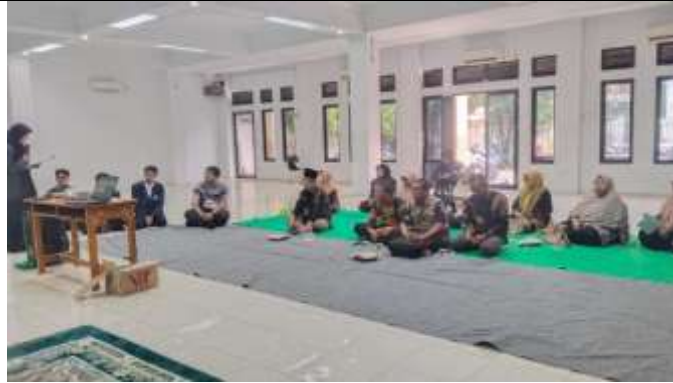
Gambar 2. Sosialisasi

Media merupakan alat untuk membantu guru dalam proses belajar mengajar di kelas yang mampu menyalurkan pesan serta merangsang perasaan serta keinginan siswa supaya terciptanya proses belajar efektif yang dikemas secara kreatif (Fadilah et al., 2023). Media pembelajaran adalah segala sesuatu yang bisa dimanfaatkan dalam menyampaikan ilmu pengetahuan kepada peserta didik dalam rangka meningkatkan wawasan, perasaan dan minat mereka khususnya dalam pelajaran sejarah (Ayu et al., 2024). Maka dari itu, pengertian media dalam proses pembelajaran cenderung dimaknai sebagai segala perlengkapan baik itu grafis, fotografis, elektronik, untuk menangkap, memproses serta merekonstruksikan informasi visual atau verbal (Nurfadhillah, 2021).