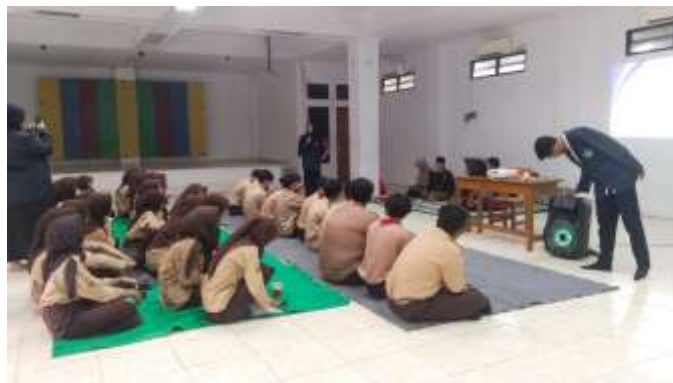
Gambar 3. Evaluasi

Media merupakan alat untuk membantu guru dalam proses belajar mengajar di kelas yang mampu menyalurkan pesan serta merangsang perasaan serta keinginan siswa supaya terciptanya proses belajar efektif yang dikemas secara kreatif (Fadilah et al., 2023). Media pembelajaran adalah segala sesuatu yang bisa dimanfaatkan dalam menyampaikan ilmu pengetahuan kepada peserta didik dalam rangka meningkatkan wawasan, perasaan dan minat mereka khususnya dalam pelajaran sejarah (Ayu et al., 2024). Maka dari itu, pengertian media dalam proses pembelajaran cenderung dimaknai sebagai segala perlengkapan baik itu grafis, fotografis, elektronik, untuk menangkap, memproses serta merekonstruksikan informasi visual atau verbal (Nurfadhillah, 2021).