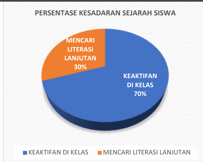
Gambar 5. Perubahan Kesadaran Sejarah

Berdasarkan hasil persentase ini, kami turut menyimpulkan bahwa penggunaan novel dan film sejarah dinilai sangat efektif dalam membentuk kesadaran sejarah bagi peserta didik.