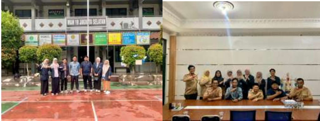
Gambar 1. MAN 19 Jakarta

Dengan demikian Penggunaan Novel dan Film sejarah dalam membentuk kesadaran sejarah menjadi salah satu referensi bagi pendidik dalam pengajaran sejarah guna membuat pembelajaran sejarah lebih efektif dan menyenangkan.