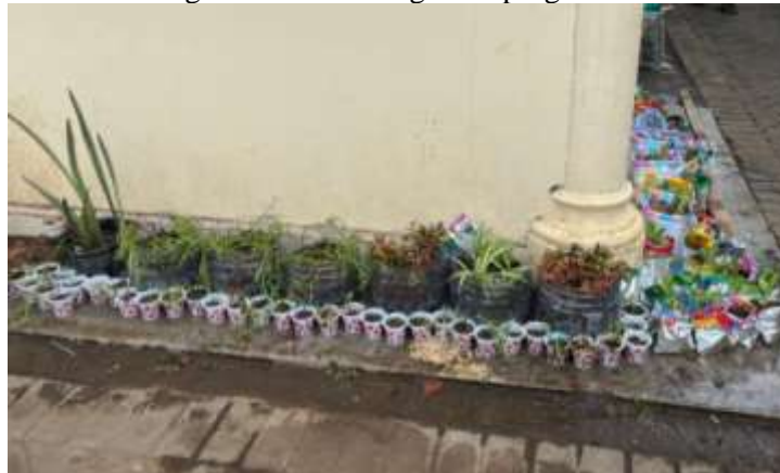
Gambar 7. Hasil Pemanfaatan Sampah Menjadi Media Tanam

Kegiatan praktik ini tidak hanya mengajarkan keterampilan teknis, tetapi juga menanamkan kesadaran ekologis melalui pengalaman langsung tentang bagaimana sampah dapat dikelola menjadi sesuatu yang bernilai bagi lingkungan. Setelah seluruh rangkaian selesai, peserta mengerjakan posttest untuk menilai peningkatan pengetahuan setelah mengikuti seluruh rangkaian program.