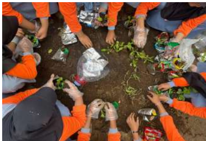
Gambar 5. Pembuatan wadah atau pot tanam dari sampah anorganik

Pembuatan pot dari sampah anorganik merupakan salah satu solusi konkret dalam program Growcycle untuk mengatasi masalah limbah plastik. Praktik ini tidak hanya mengurangi volume sampah yang sulit terurai, tetapi juga mengubah limbah problematik menjadi produk fungsional berupa wadah tanam. Dengan menyediakan "wadah" untuk media tanam dari kompos dan hydrogel pembalut, kegiatan ini menjadi penghubung penting yang mewujudkan tema utama Growcycle, yaitu "Mengubah Sampah Menjadi Siklus Kehidupan Baru", di mana limbah diubah menjadi elemen pendukung pertumbuhan.