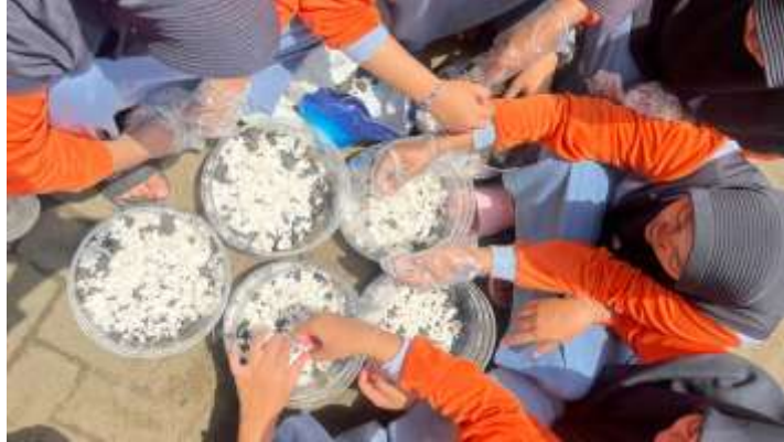
Gambar 6. Pemanfaatan limbah pembalut sekali pakai sebagai media tanam alternatif

Pemanfaatan pembalut sekali pakai sebagai media tanam adalah sebuah solusi inovatif untuk mengelola sampah domestik yang sering terabaikan dan memiliki dampak buruk bagi lingkungan karena sangat sulit terurai. Melalui langkah-langkah pemisahan dan pencucian yang higienis, hydrogel atau kapas pembalut dapat dialihfungsikan menjadi komponen media tanam yang bernilai guna. Praktik ini tidak hanya mengurangi volume sampah di TPA, tetapi juga secara kreatif mengubah limbah problematik menjadi media tanam yang siap digunakan.