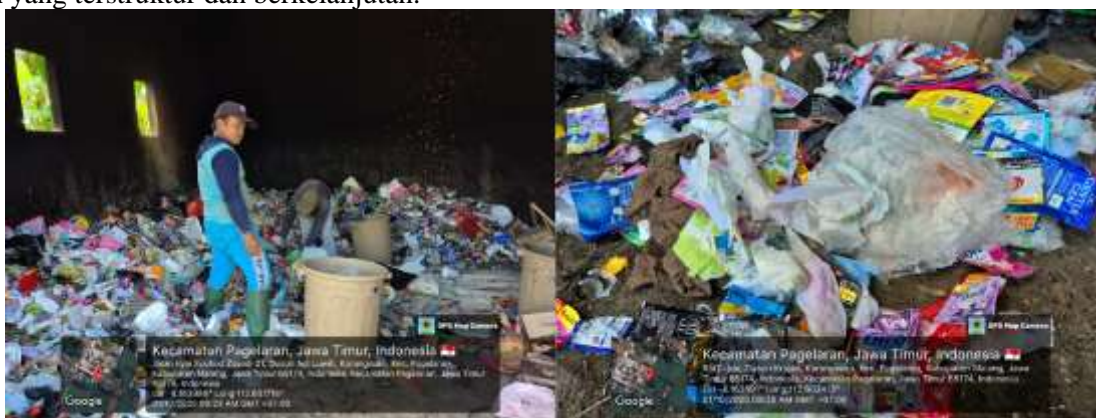
Gambar 1. Kondisi awal pengelolaan sampah di lingkungan MA Al-Khoirot Malang

Pondok Pesantren Al-Khoirot (PPA) memiliki karakteristik unik sebagai lingkungan asrama santri yang menyelenggarakan pendidikan formal dan non-formal secara terintegrasi dengan jumlah santri yang relatif besar. Seiring berkembangnya kawasan sekitar, kondisi mitra menunjukkan adanya tantangan signifikan dalam pengelolaan lingkungan dan sampah. Kendala krusial yang berdampak pada kenyamanan dan kualitas lingkungan sekolah tersebut meliputi: (1) kondisi lingkungan yang cenderung gersang akibat minimnya vegetasi peneduh dan tanaman produktif; (2) belum diterapkannya sistem pemilahan sampah di tingkat sumber sehingga sampah organik, anorganik, dan residu masih tercampur; (3) tidak tersedianya sarana dan prasarana pengolahan sampah di lingkungan sekolah sehingga sampah langsung diangkut ke Tempat Pembuangan Akhir (TPA) atau dibakar; (4) belum adanya pengelolaan terpisah dan aman terhadap limbah pembalut sekali pakai yang berisiko terhadap sanitasi; (5) rendahnya pengetahuan dan keterampilan warga sekolah dalam pemilahan serta pemanfaatan sampah; serta (6) belum tersusunnya program edukasi dan pendampingan pengelolaan sampah yang terstruktur dan berkelanjutan.