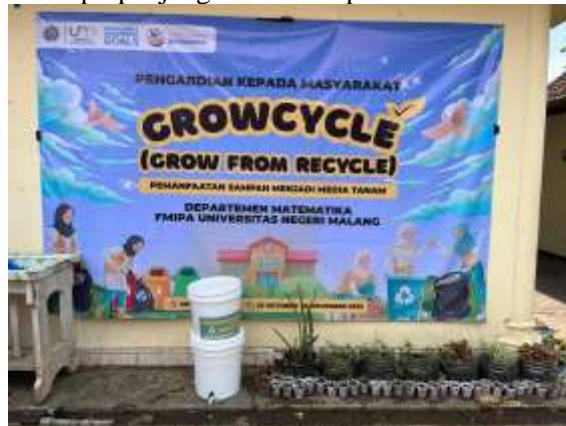
Gambar 4. Pembuatan media tanam kompos dari sampah organik

Pembuatan kompos adalah cara sederhana, murah, dan efektif untuk mengubah sampah organik yang sering dianggap tidak bernilai menjadi sumber daya yang bermanfaat secara ekologis sekaligus ekonomis. Melalui berbagai metode seperti Takakura, bokashi, vermicompos, atau pupuk organik cair, masyarakat dapat mengurangi sampah rumah tangga, menghasilkan pupuk alami yang menyehatkan tanah, dan menumbuhkan kesadaran ekologis dan kemandirian lingkungan. Membuat kompos bukan hanya soal mengolah sampah, tetapi tentang mengembalikan kehidupan ke tanah, menjaga keseimbangan alam, dan memperpanjang siklus hidup bumi itu sendiri.