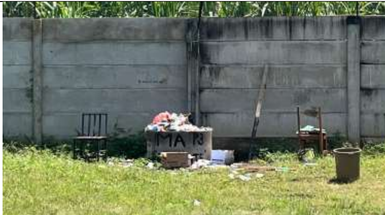
Gambar 2. Tempat pembuangan sampah sementara di MA Al-Khoirot Malang

Kondisi ini menunjukkan perlunya intervensi pengabdian masyarakat yang terintegrasi melalui pendekatan edukatif dan praktik langsung untuk meningkatkan kesadaran serta keterampilan pengelolaan sampah di MA Al-Khoirot Malang.