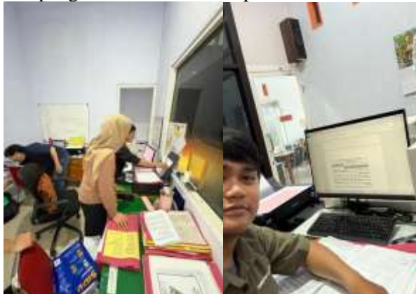
Gambar 1. Kegiatan Magang

Kegiatan magang di kantor notaris sebagai bentuk pengabdian masyarakat memberikan kontribusi nyata dalam pelayanan hukum perdata. Mahasiswa terlibat langsung dalam beberapa tahapan kegiatan yang berkaitan dengan pembuatan dan pengadministrasian akta perdata.