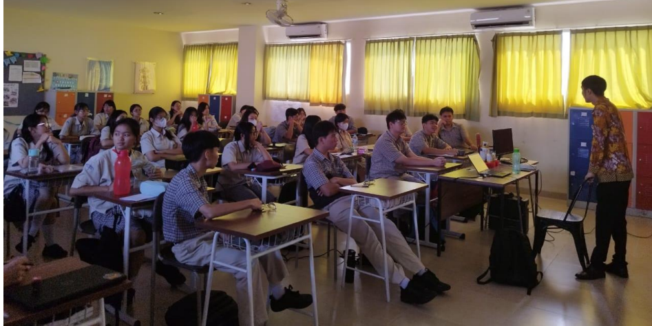
Gambar 2. Pelaksanaan Sosialisasi

seorang penulis buku perpajakan atau penulis artikel di jurnal-jurnal perpajakan. Kemudian, bisa menjadi instruktur kursus perpajakan seperti brevet. Keempat, sektor wirausaha dimana bisa menjadi konsultan pajak mandiri. Kemudian, bisa menjadi founding partner firma konsultan. Kemudian, bisa menjadi tax technology startup dalam bentuk inovasi digital dan menjadi seorang konten kreator edukasi perpajakan. Pengembangan tren profesi konsultan pajak ini menunjukkan peningkatan yang sangat tinggi baik dari sisi permintaan edukasi perpajakan, pembayaran dan pelaporan pajak dari Wajib Pajak kepada Direktorat Jenderal Pajak (DJP) seiring dengan meningkatnya kompleksitas di bidang regulasi perpajakan dan pengembangan digitalisasi perpajakan.