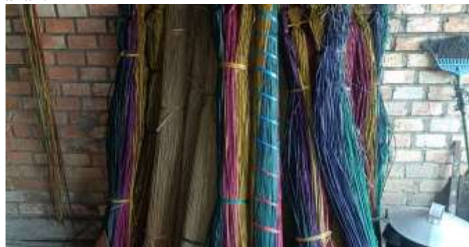
Gambar 3. Hasil kerajinan Tikar Purun

Hasil wawancara menunjukkan bahwa kerajinan tikar purun di Desa Tanjung Baru Petai merupakan aktivitas yang dilakukan secara turun-temurun oleh ibu rumah tangga sebagai pengisi waktu luang sekaligus sumber penghasilan tambahan.