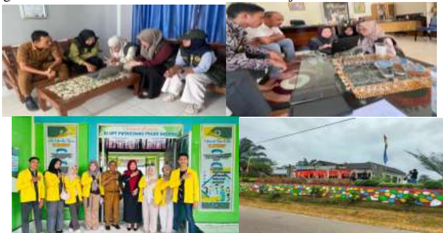
Gambar 1. Lokasi pengabdian Masyarakat

Berdasarkan permasalahan tersebut, kegiatan pengabdian kepada masyarakat difokuskan pada dua aspek utama, yaitu peningkatan kesadaran masyarakat tentang pentingnya aktivitas fisik melalui edukasi gerak aktif sederhana serta peningkatan kapasitas pelaku usaha mikro dalam melakukan pencatatan keuangan usaha secara sederhana. Kegiatan ini diharapkan dapat membantu masyarakat menjaga kesehatan sekaligus meningkatkan pengelolaan usaha secara lebih teratur dan berkelanjutan.