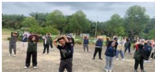
Gambar 3. Edukasi Dan Senam Gerak Aktif

Berdasarkan temuan tersebut, kegiatan pengabdian dilaksanakan melalui edukasi kesehatan yang disertai praktik gerak aktif menggunakan pendekatan partisipatif. Metode ini dipilih karena memungkinkan masyarakat tidak hanya menerima informasi, tetapi juga langsung mempraktikkan gerakan yang diperagakan. Hasil kegiatan menunjukkan bahwa peserta terlibat aktif selama kegiatan berlangsung dan mulai memahami bahwa aktivitas fisik dapat dilakukan melalui gerakan sederhana yang dapat diterapkan dalam kehidupan sehari-hari. Temuan ini menunjukkan bahwa pendekatan edukasi berbasis praktik mampu meningkatkan kesadaran masyarakat mengenai pentingnya aktivitas fisik untuk menjaga kebugaran tubuh (Zahrany et al., 2024).