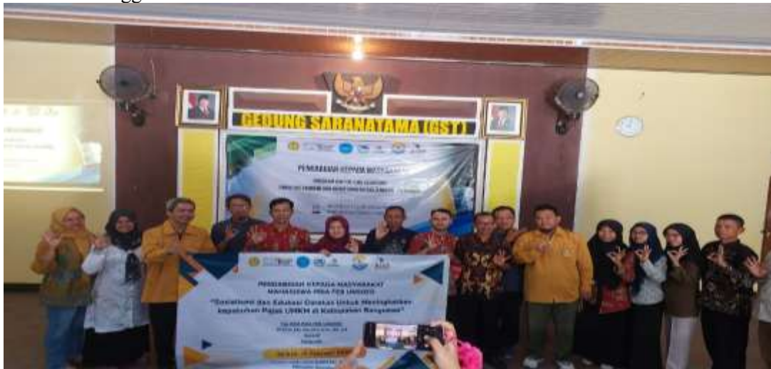
Gambar 1. Lokasi Kegiatan Pengabdian Kepada Masyarakat

Kabupaten Banyumas merupakan salah satu daerah dengan pertumbuhan UMKM yang cukup pesat di Provinsi Jawa Tengah. UMKM di wilayah ini bergerak di berbagai sektor seperti perdagangan, kuliner, jasa, dan industri rumah tangga.