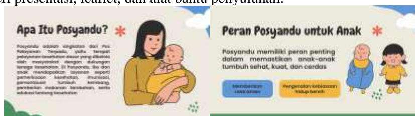
Gambar 3. Materi edukasi Posyandu

Pada tahap ini dilakukan observasi awal dan koordinasi dengan pihak desa serta kader Posyandu untuk mengidentifikasi permasalahan yang dihadapi terkait kesehatan ibu dan balita. Selain itu, dilakukan penyusunan materi edukasi mengenai kesehatan ibu dan anak, gizi seimbang pada balita, serta pentingnya pemantauan tumbuh kembang anak melalui kegiatan Posyandu. Tim pengabdian juga menyiapkan media edukasi berupa materi presentasi, leaflet, dan alat bantu penyuluhan.