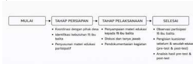
Gambar 2. Alur Tahapan Kegiatan

Kegiatan pengabdian kepada masyarakat ini dilaksanakan di Desa Tegal Kertha pada bulan Januari 2026 dengan sasaran utama ibu balita yang aktif mengikuti kegiatan Posyandu. Berdasarkan data Posyandu setempat, jumlah ibu balita yang terdaftar sebanyak 120 orang dengan tingkat kehadiran rata-rata 80–90 ibu balita setiap bulan. Namun, pada saat pelaksanaan kegiatan pengabdian ini jumlah peserta yang hadir sebanyak 15 ibu balita. Kegiatan ini juga melibatkan kader Posyandu, perangkat desa, serta tenaga kesehatan setempat sebagai mitra dalam pelaksanaan kegiatan. Metode yang digunakan dalam kegiatan ini adalah edukasi partisipatif dan pendampingan kegiatan Posyandu yang dilaksanakan melalui tiga tahapan kegiatan, yaitu tahap persiapan, pelaksanaan, dan evaluasi.