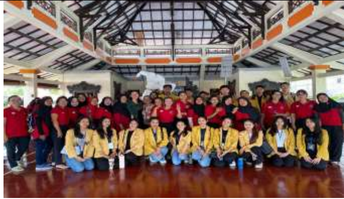
Gambar 1. Foto Bersama Kader Posyandu Desa Tegal Kertha