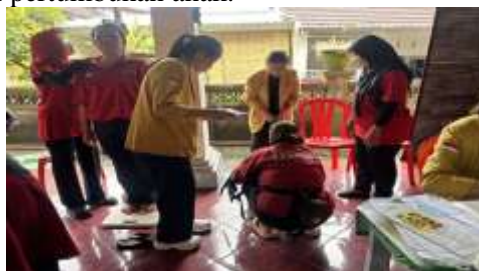
Gambar 5. Penimbangan berat badan balita

Selain hasil evaluasi melalui kuesioner, peningkatan pemahaman ibu balita juga terlihat dari keterlibatan aktif peserta selama kegiatan berlangsung. Ibu balita terlihat lebih aktif mengikuti proses penimbangan berat badan balita, pengukuran tinggi badan, serta pencatatan perkembangan anak selama kegiatan Posyandu berlangsung. Interaksi antara ibu balita dengan tim pendamping juga meningkat, terlihat dari adanya diskusi dan pertanyaan yang diajukan peserta terkait kebutuhan gizi anak, tanda bahaya kesehatan pada balita, serta cara memahami hasil pemantauan pertumbuhan anak.