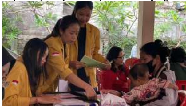
Gambar 4. Pelaksanaan kegiatan pendampingan