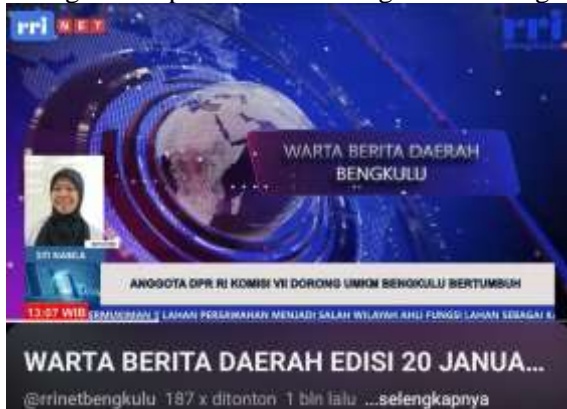
Galmbalr 6. Publikasi Berital

Kegiatan ini bertujuan memberikan pemahaman komprehensif mengenai mekanisme kerja jurnalistik di lembaga penyiaran publik sekaligus meningkatkan kompetensi teknis dan nonteknis penulis. Ketercapaian tujuan dapat dilihat dari kemampuan penulis dalam memahami alur produksi berita secara utuh dan mempraktikkannya secara mandiri. Penulis mampu melakukan peliputan lapangan, menyusun naskah yang memenuhi standar redaksi, serta melakukan proses rekaman dan editing dengan pengawasan minimal. Keberhasilan juga diukur dari tayangnya hasil produksi berita dalam program siaran serta publikasi di media digital lembaga. Selain itu, peningkatan kepercayaan diri, keterampilan komunikasi interpersonal, dan keberanian dalam menghadapi narasumber menjadi indikator penting yang menunjukkan perkembangan kompetensi selama kegiatan berlangsung.