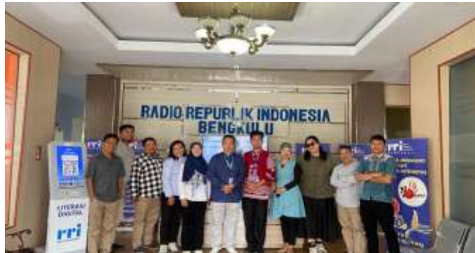
Gambar 1. Lokasi PKM