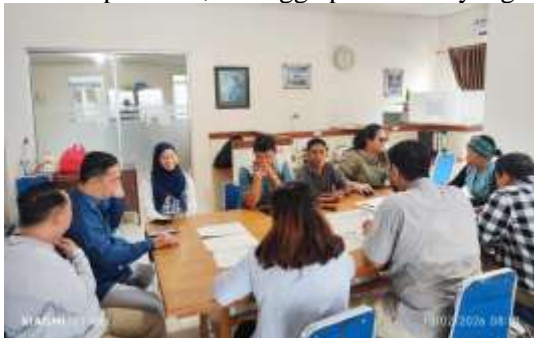
Gambar 2. Agenda Setting

Selain itu, kemampuan teknis dalam proses dubbing dan editing audio juga mengalami peningkatan yang signifikan. Hal ini terlihat dari berkurangnya kesalahan teknis seperti noise dan ketidakseimbangan audio dalam hasil produksi akhir. Jika dibandingkan dengan kondisi awal sebelum pelatihan, kualitas berita yang dihasilkan menjadi lebih layak siar dan adaptif terhadap kebutuhan platform digital. Keberhasilan metode ini tidak terlepas dari pendekatan praktik langsung ( learning by doing ) yang dikombinasikan dengan pendampingan intensif. Pendekatan ini sejalan dengan temuan penelitian sebelumnya yang menyatakan bahwa pelatihan berbasis praktik lebih efektif dalam meningkatkan keterampilan teknis penyiaran dibandingkan metode ceramah semata. Namun demikian, masih terdapat beberapa kendala, seperti keterbatasan waktu pelatihan dan adaptasi teknologi digital yang belum merata pada seluruh peserta, sehingga menjadi bahan evaluasi untuk kegiatan selanjutnya. Untuk memperkuat hasil analisis, disarankan penyajian data peningkatan kemampuan mitra dalam bentuk tabel atau grafik yang membandingkan nilai pre-test dan post-test, sehingga perubahan yang terjadi dapat terlihat secara lebih jelas dan terukur.