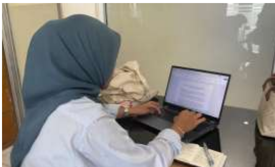
Gambar 4. Penulisan Naskah