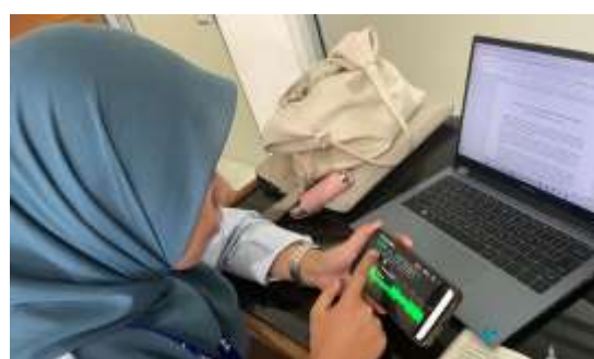
Gambar 5. Rekaman