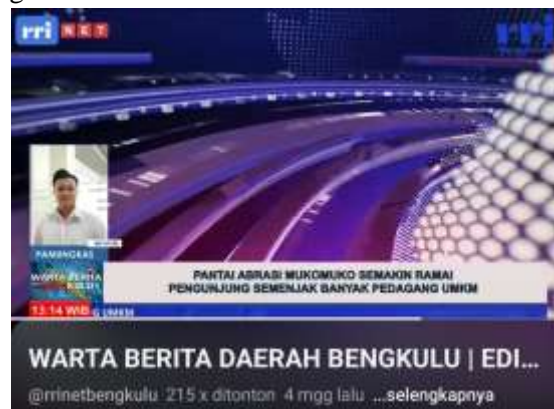
Galmbalr 7. Publikasi Berital

Dalam praktiknya, terdapat sejumlah tantangan yang memengaruhi proses pelaksanaan kegiatan. Kesulitan utama terletak pada pencarian ide berita yang memiliki nilai aktual dan relevan bagi masyarakat. Di tengah arus informasi digital yang sangat cepat, redaksi dituntut untuk mampu menghadirkan perspektif yang berbeda dan tetap menjaga akurasi (Berita, 2025). Hambatan lain muncul saat proses peliputan, terutama dalam memperoleh narasumber yang bersedia diwawancarai atau memberikan informasi secara terbuka. Kondisi lapangan yang tidak selalu kondusif, seperti kebisingan lingkungan, juga berdampak pada kualitas audio sehingga membutuhkan proses penyuntingan tambahan. Tantangan-tantangan tersebut menjadi bagian dari pembelajaran nyata yang membentuk ketahanan mental, ketelitian, serta kemampuan problem solving peserta.