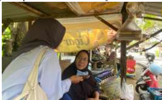
Gambar 3. Wawancara