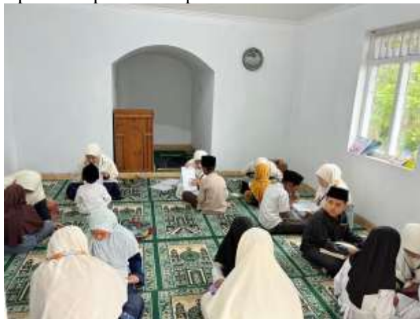
Gambar 2: Penyampaian Materi Toleransi Beragama di TPA Al-Hidayah

Dokumentasi kegiatan dapat dilampirkan berupa: