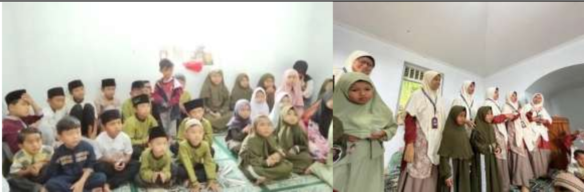
Gambar 3: Diskusi dan Tanya Jawab Bersama Santri.

Pelaksanaan kegiatan yang melibatkan ceramah interaktif dan storytelling menunjukkan bahwa santri lebih aktif dalam merespons materi dibandingkan metode ceramah satu arah. Hal ini terlihat dari meningkatnya partisipasi santri dalam sesi tanya jawab dan diskusi ringan. Kondisi ini menunjukkan bahwa pendekatan partisipatif lebih efektif dalam pembelajaran anak usia dini yang membutuhkan interaksi langsung dalam memahami materi.