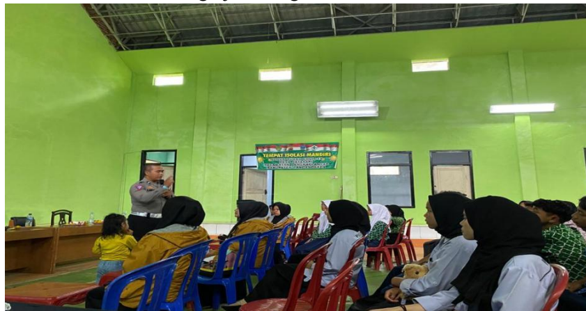
Gambar 5. Materi Tata Tertib Berkendaraan

Selain itu perekonomian mereka juga menjadi faktor anak putus sekolah dan kurang berminat dalam pendidikan, sehingga mereka memilih untuk bekerja ke luar kota agar bisa membantu perekonomian keluarganya. Kemudian terdapat faktor lainnya seperti pergaulan dengan teman yang tidak melanjutkan sekolah, dan si anak tersebut terpengaruh oleh temannya. Karena melihat temannya pagi-pagi tidak harus berangkat sekolah, bebas bermain dan tidak harus mengerjakan tugas sekolah.