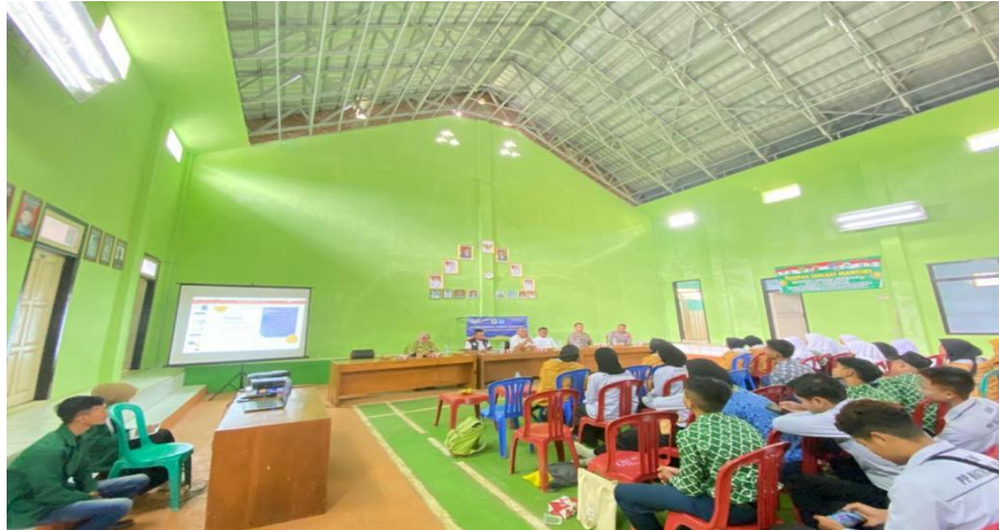
Gambar 2. Sambutan-Sambutan

mendapatkan pekerjaan yang layak. Dengan begitu, kedatangan tim KKN di Desa Jayasari menjadi sedikit penerang bagi perangkat desa untuk mulai membenahi motivasi warga desanya.