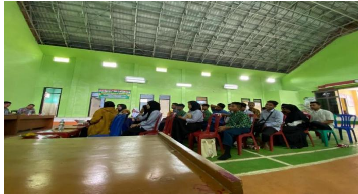
Gambar 4. Diskusi dan Sharing

kemudian di akhir penyampaian materi dilakukan diskusi dan sharing bersama peserta seminar.