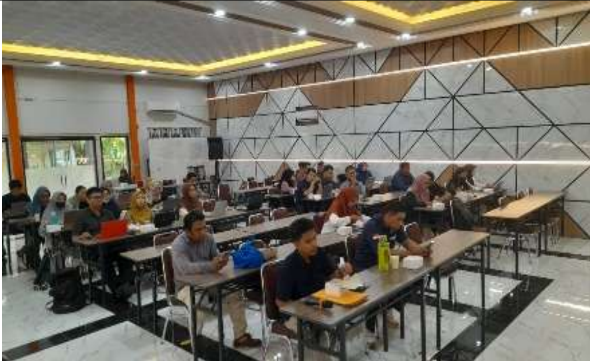
Gambar 1. Suasana kegiatan workshop

Hasil evaluasi diperoleh dari angket daring (Google Form) yang diisi oleh peserta setelah kegiatan berlangsung. Secara umum, kegiatan memperoleh tingkat keberhasilan yang sangat baik, ditunjukkan dengan tingginya pemahaman peserta terhadap perbedaan antara borang LAMDIK versi 1.0 dan 2.0. Temuan utama dari hasil evaluasi dapat dirangkum sebagai berikut: