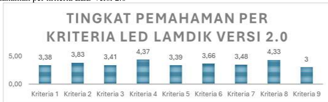
Gambar 4. Tingkat Pemahaman peserta per kriteria

Sebagaimana ditunjukkan pada Gambar 4, secara umum, peserta menunjukkan pemahaman yang baik pada Kriteria 4 Sumber Daya dan Kriteria 8 (Pengabdian kepada Masyarakat), sementara Kriteria 9 (Penjaminan Mutu) menjadi area yang paling menantang karena merupakan tambahan baru pada versi 2.0.