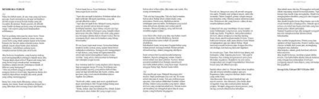
Gambar 1. Puisi Meneroka Tubuh ( Mendaki dingin: Segenggam puisi , Pelataran Sastra Kaliwungu, 2020)