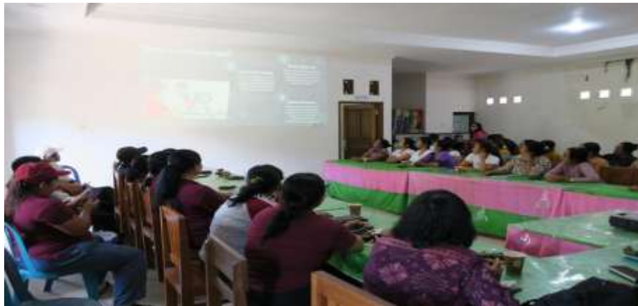
Gambar 2. Pemaparan Materi Oleh Narasumber

Dengan demikian, kegiatan ini tidak hanya berdampak pada peningkatan pengetahuan, tetapi juga pada perubahan perilaku peserta dalam melakukan deteksi dini kanker payudara. Hal ini menjadi indikator bahwa edukasi berbasis praktik dapat menjadi solusi efektif dalam meningkatkan kapasitas masyarakat, khususnya ibu PKK, dalam upaya preventif kesehatan. Hasil dari penyuluhan dan pemberian materi dapat dilihat pada gambar berikut: