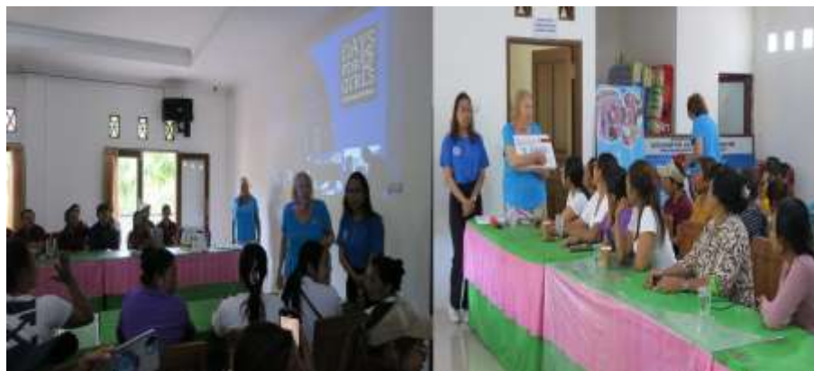
Gambar 3. Pemaparan Materi Kesehatan Reproduksi Oleh Days For Girls

Setelah praktek diadakan pembagian souvenir berupa kit yang berisi celana dalam wanita dan pembalut yang bisa dicuci dan dipakai berulang kali dan bisa dilihat pada gambar berikut: