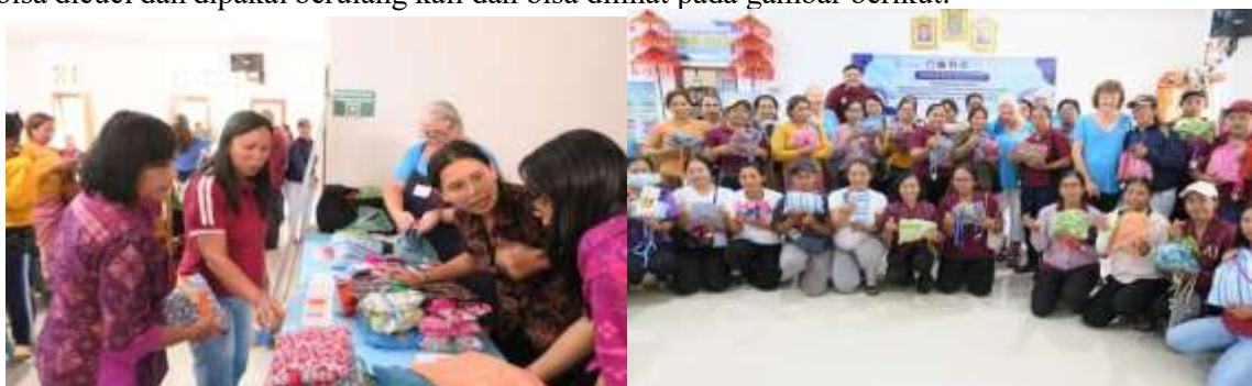
Gambar 4. Pembagian Kit Oleh Tim Days For Girls Australia

Setelah praktek diadakan pembagian souvenir berupa kit yang berisi celana dalam wanita dan pembalut yang bisa dicuci dan dipakai berulang kali dan bisa dilihat pada gambar berikut: