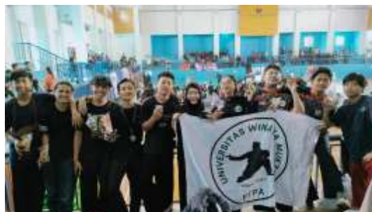
Gambar 1. Peran Dosen Pendamping UKM untuk Pencapaian Mahasiswa Berprestasi Olahraga

Peran dosen sebagai pembina UKM menjadi krusial dalam menciptakan sinergi antara kegiatan pengabdian, pembelajaran, dan pembinaan prestasi mahasiswa sebagaimana tertuang dalam kebijakan institusi (Nurrahmi et al., 2024).