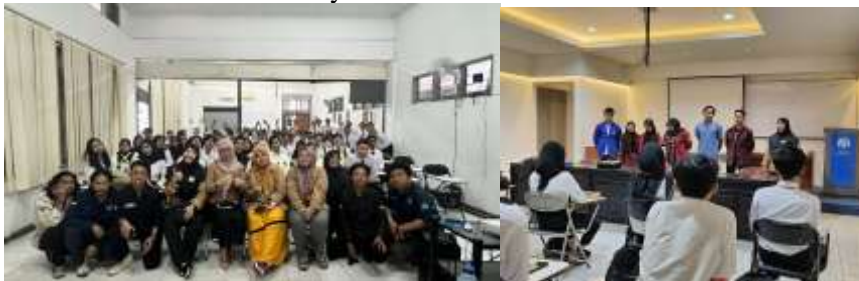
Gambar 2. Sosialisasi Peran Dosen Kegiatan PKM

Kegiatan pengabdian kepada masyarakat ini dilaksanakan di Fakultas Teknik, Perencanaan, dan Arsitektur Universitas Winaya Mukti dengan sasaran utama dosen yang sedang atau akan mengajukan kenaikan jabatan akademik. Peserta dalam kegiatan ini berasal dari berbagai program studi di Fakultas Teknik dan Perencanaan Arsitektur Universitas Winaya Mukti.