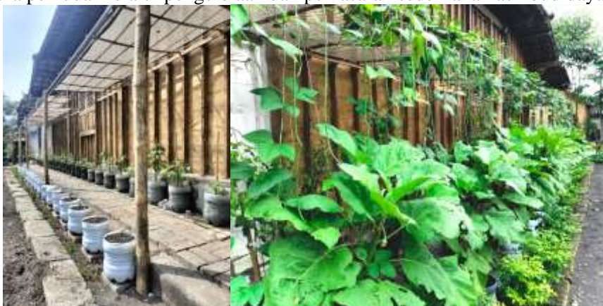
Gambar 3. Hasil vegetasi

Pelatihan diberikan kepada pemuda Lore-X untuk memperkenalkan lubang tanam, serta pemasangan sistem irigasi tetes. Foto ini menunjukkan momen ketika peserta mengikuti sesi praktik langsung dan mempelajari dasar-dasar perakitan instalasi vertigasi. Program ini juga memperkuat sisi sosial komunitas melalui terbentuknya Kelompok Tani Muda Lore-X sebagai wadah keberlanjutan kegiatan. Kelompok ini berfungsi sebagai organisasi pengelola kebun vertigasi komunitas sekaligus pusat kegiatan edukasi lingkungan bagi warga sekitar. Selain itu, pendampingan intensif membantu komunitas menyusun modul pelatihan vertigasi tetes yang kini dapat dijadikan panduan replikasi ke wilayah lain. Instalasi vertigasi yang telah beroperasi menghasilkan sayuran organik seperti kangkung, bayam, dan sawi, yang bermanfaat bagi konsumsi komunitas serta berpotensi dikembangkan menjadi unit usaha kecil berbasis produk pertanian ramah lingkungan. Hasil panen ini tidak hanya meningkatkan ketahanan pangan lokal, tetapi juga menumbuhkan semangat wirausaha pemuda melalui pengelolaan dan pemasaran sederhana hasil budidaya.