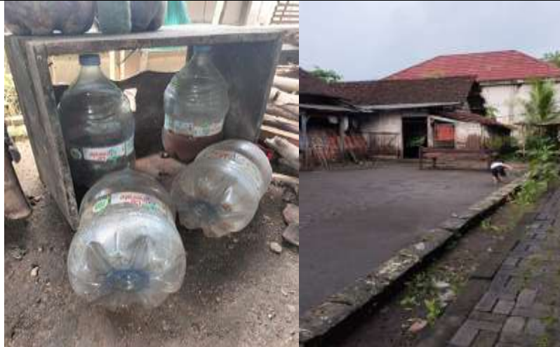
Gambar 1. Kondisi Lingkungan

Permasalahan utama yang ditemukan di lingkungan komunitas adalah tingginya jumlah limbah botol plastik yang belum dimanfaatkan secara produktif. Selain itu, pemuda di komunitas tersebut masih memiliki keterbatasan pengetahuan dan keterampilan dalam pengelolaan limbah plastik serta pengembangan kegiatan ekonomi produktif berbasis lingkungan. Kondisi ini menyebabkan potensi sumber daya yang tersedia di lingkungan belum dimanfaatkan secara optimal. Oleh karena itu diperlukan program pemberdayaan yang mampu mengintegrasikan aspek lingkungan, sosial, dan ekonomi melalui kegiatan yang inovatif dan aplikatif. Permasalahan ini sejalan dengan temuan bahwa rendahnya kapasitas masyarakat dalam pengelolaan limbah plastik menjadi salah satu faktor utama belum optimalnya pemanfaatan limbah sebagai sumber ekonomi alternatif berbasis lingkungan (Pratiwi et al., 2022). Selain itu, pendekatan pemberdayaan berbasis praktik langsung dan pemanfaatan teknologi sederhana terbukti efektif dalam meningkatkan keterampilan masyarakat serta mendorong terbentuknya kegiatan ekonomi produktif yang berkelanjutan (Fajeriana et al., 2025).