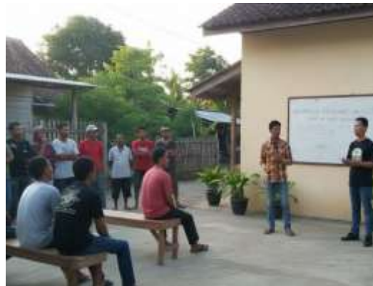
Gambar 2. Pelatihan Pengolahan Botol Bekas menjadi Media Tanam

sosial, maupun ekonomi. Melalui rangkaian pendampingan partisipatif, program ini berhasil mentransformasi botol bekas Le Mineral yang sebelumnya tidak bernilai menjadi instalasi pertanian vertikal berbasis sistem vertigasi tetes yang efisien air dan ramah lahan. Pembangunan instalasi ini bukan hanya menghadirkan model fisik eco-urban farming, tetapi juga menjadi sarana pembelajaran kolektif bagi pemuda mengenai konsep ekonomi sirkular, pemanfaatan limbah plastik, dan teknologi tepat guna. Peningkatan kapasitas pemuda sangat terlihat melalui keterlibatan langsung dalam proses identifikasi masalah, pembuatan instalasi, perawatan tanaman, hingga pengelolaan hasil panen. Pengetahuan dan keterampilan baru terkait budidaya sayuran, irigasi tetes, teknik daur ulang, serta dasar-dasar kewirausahaan hijau mendorong perubahan pola pikir mereka dari sekadar pengguna menjadi inovator lingkungan.