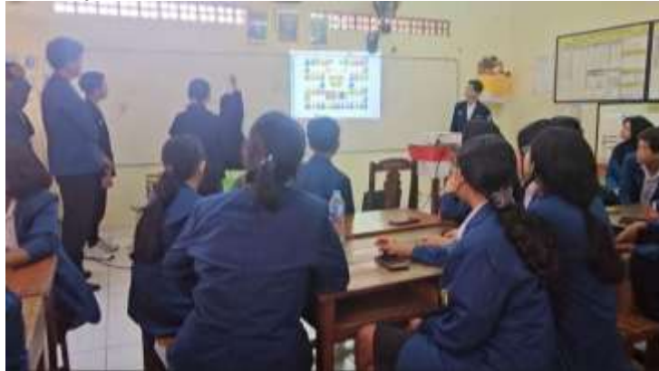
Gambar 2. Pelaksanaan Kegiatan Implementasi

Pengaplikasian gamifikasi berbasis Flippity ini sangat memungkinkan untuk terus dimanfaatkan dan dikembangkan. Pengembangan dapat dilakukan melalui variasi jenis permainan yang lebih beragam serta penyesuaian tingkat kesulitan soal dengan kemampuan siswa, sehingga dapat mendukung proses pembelajaran yang lebih efektif dan berkelanjutan.