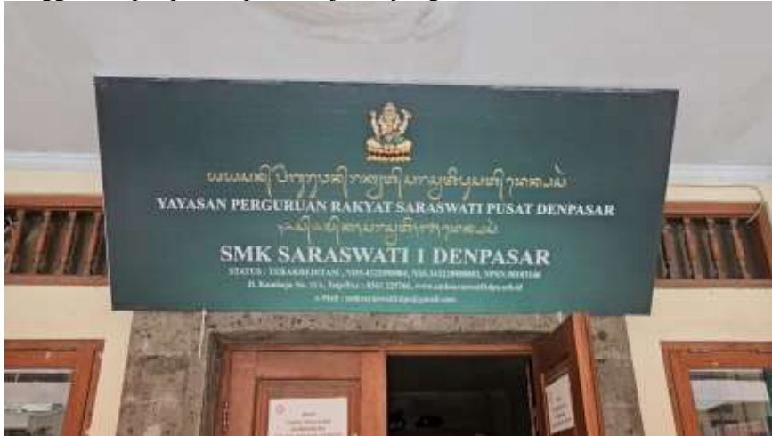
Gambar 1. SMK Saraswati 1 Denpasar

Dengan demikian penerapan gamifikasi berbasis Flippity dapat menjadi salah satu solusi bagi tenaga pendidik untuk meningkatkan keaktifan siswa dan proses pembelajaran akuntansi yang lebih efektif dan menyenangkan sehingga tercipta proses pembelajaran yang berkualitas.