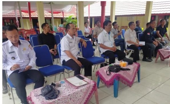
Gambar 1. Peserta Pelatihan Kepuasan kerja