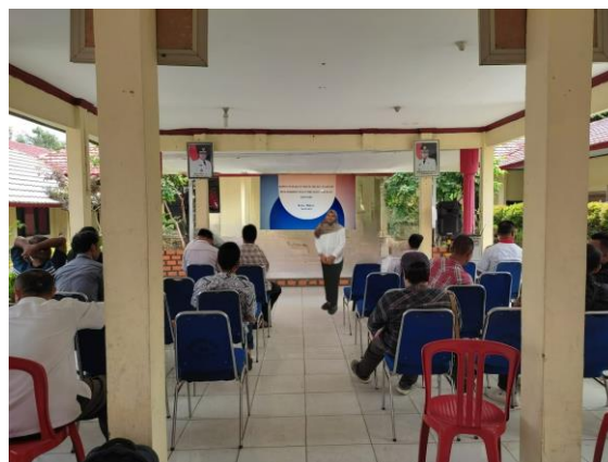
Gambar 2. Pemberian materi Kepuasan kerja

Pemberian skala pre-test kepada peserta pelatihan sebelum pelatihan tentang kepuasan kerja dan pemberian pre-test sesudah pelatihan tentang kepuasan kerja.