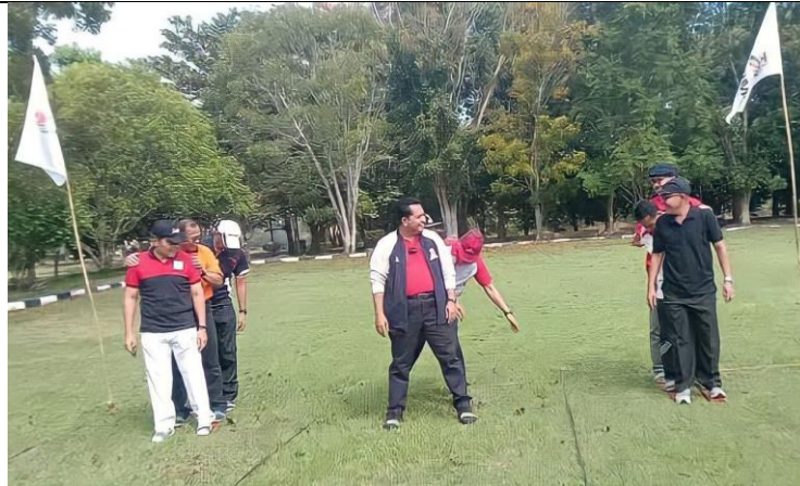
Gambar 3. Pelaksanaan Ice Breaking