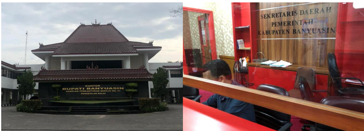
Gambar 1. Lokasi Kegiatan

Konflik-konflik ini jugalah yang terjadi di Bagian Tata Pemerintahan dan Kerjasama Sekretariat Daerah Kabupaten Banyuwasin. Meskipun bukan merupakan konflik yang besar, namun jika terus dibiarkan maka akan mempengaruhi jalannya fungsi instansi. Karena sejatinya konflik kecil tersebut dapat menjadi batu sandungan dan menghambat tercapainya tujuan instansi secara optimal. Di dalam bagian Tata Pemerintahan dan Kerjasama, kerjasama tim yang dimiliki oleh para karyawan baik ASN maupun staf honorer dirasakan sudah cukup baik. Namun, kadang masih terjadi perbedaan pendapat yang memicu perdebatan antar karyawan. Terasa juga ada kesenjangan antara beberapa karyawan dengan karyawan lainnya terutama pada karyawan perempuan sehingga terbagi menjadi dua kelompok kecil. Dikarenakan permasalahan yang telah diuraikan diatas, maka penulis membuat program Ice Breaking berbentuk permainan memindahkan bola secara estafet dengan menggunakan media pipa sebagai upaya meningkatkan kerjasama tim di bagian Tata Pemerintahan dan Kerjasama Sekretariat Daerah Kabupaten Banyuwasin.