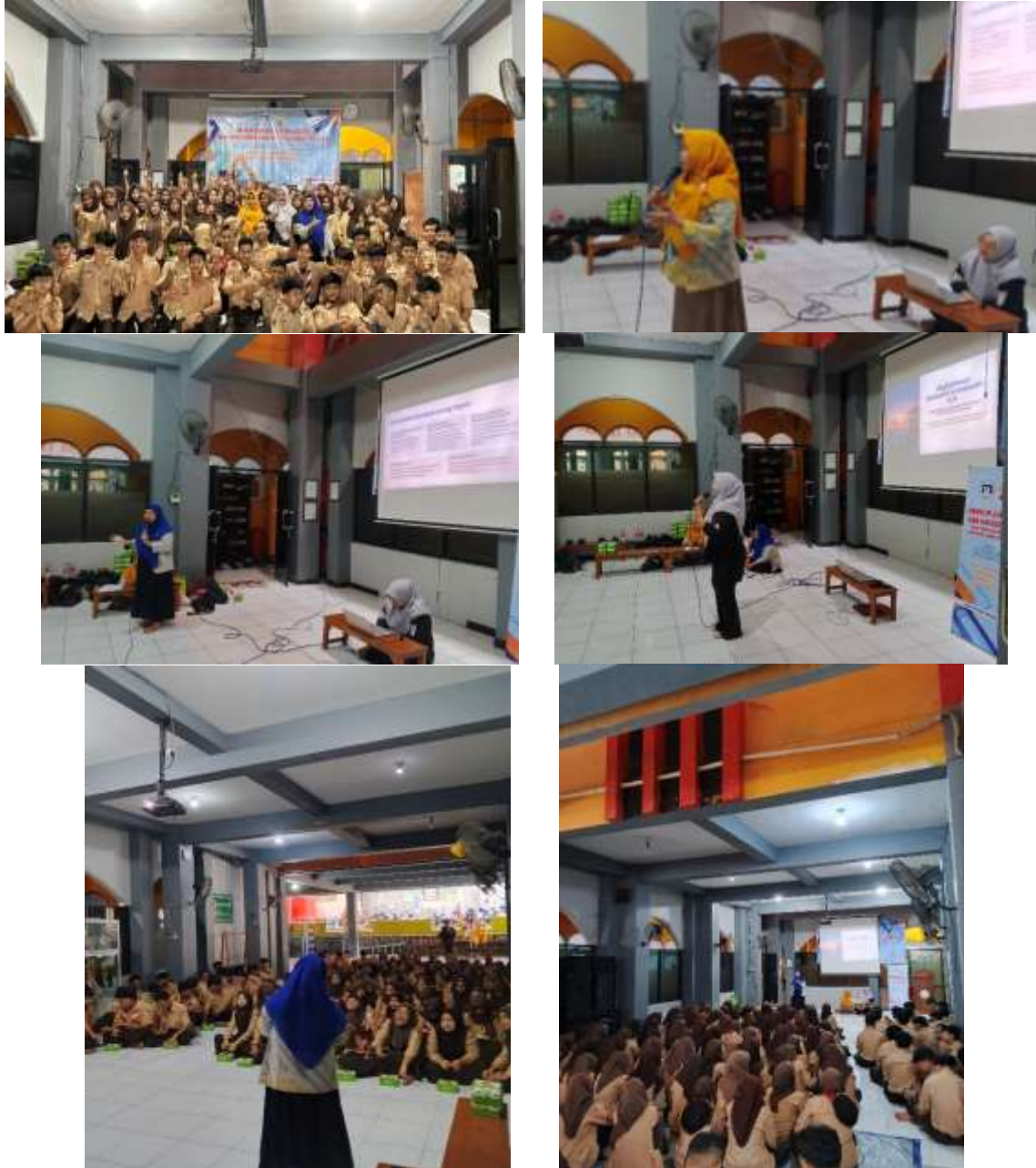
Gambar 1. Dokumentasi Hasil Kegiatan